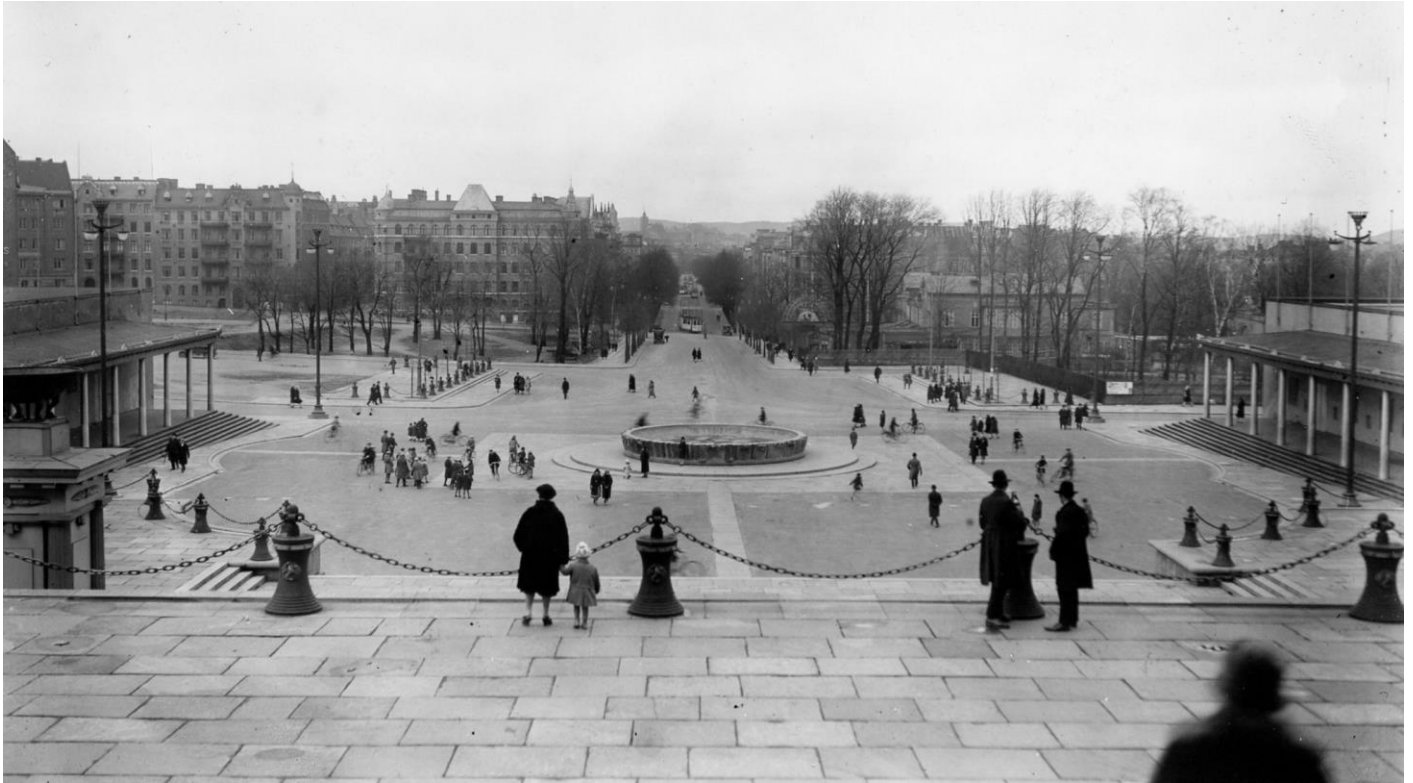
Götaplatsen år 1930