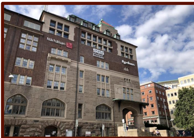
Friser i sten av konstnären Carl Eldh hittas i fasaden ovanför huvudentrén.

Från början upptog byggnaden inte hela kvarteret, utan några kasernbyggnader fanns kvar i den södra delen som slöts an vid en tillbyggnad först 1946. Ännu en tillbyggnad gjordes 1955 och året därefter, 1956, blev halva gården tomt till ett fyravåningshus. Detta ledde till att en kulturminnesmärkt portal från den gamla