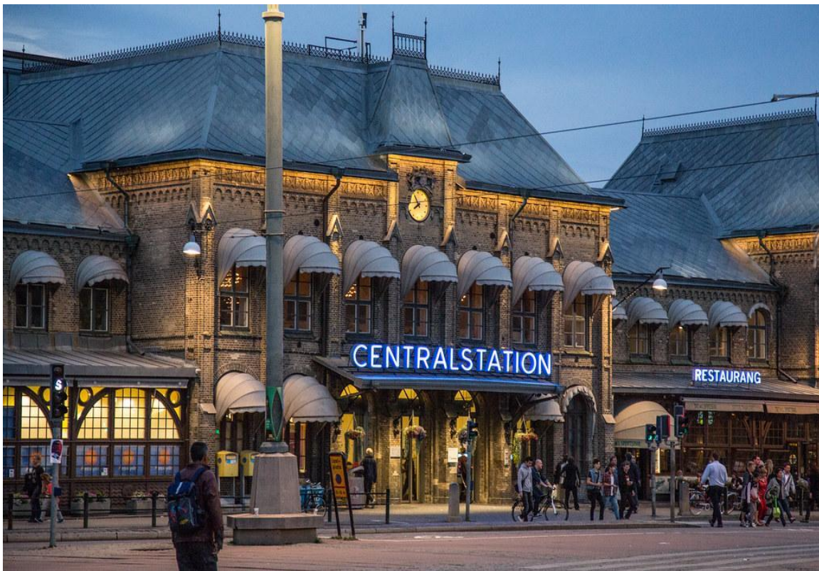
Göteborgs centralstations södra entré (Tony Webster, Flickr)