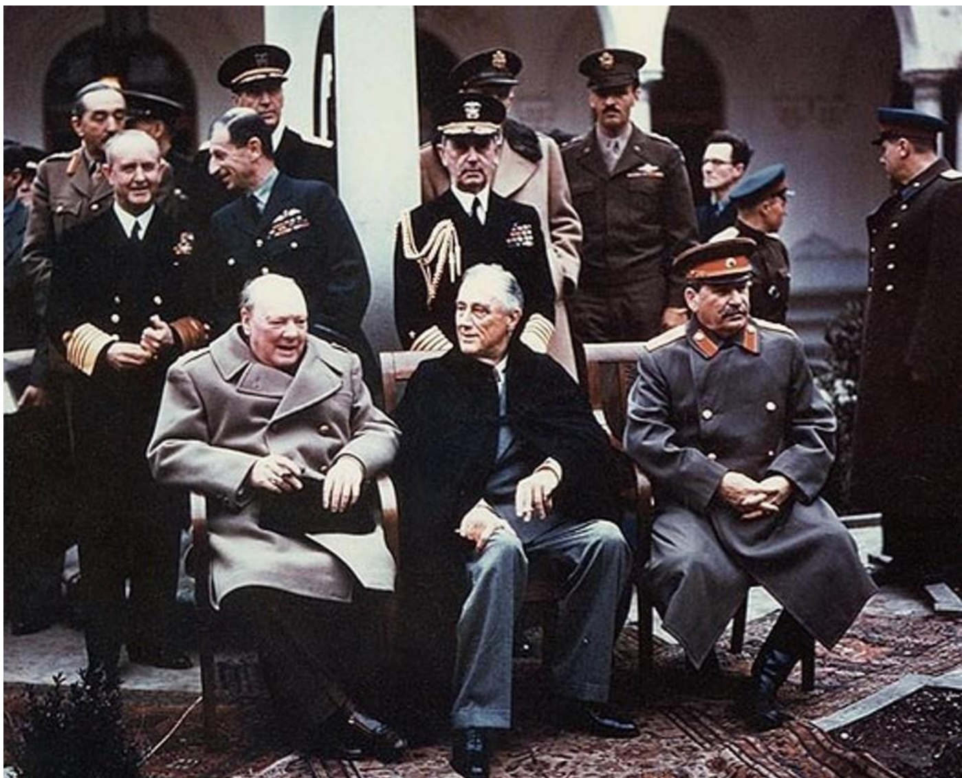
Jalta – Februari 1945: Churchill, Roosevelt och Stalin

Jaltakonferensen behandlade även Tysklands och Österrikes uppdelande i fyra ockupationszoner för de respektive allierade stormakterna, vilket skulle ha avgörande betydelse för Tysklands framtida delande. Sovjetunionen gick även med på att anfalla Japan tre månader efter det att Tyskland kapitulerat, vilket skedde i och med den sovjetiska invasionen av Manchuriet och den norra delen av Koreahalvön i augusti till september.