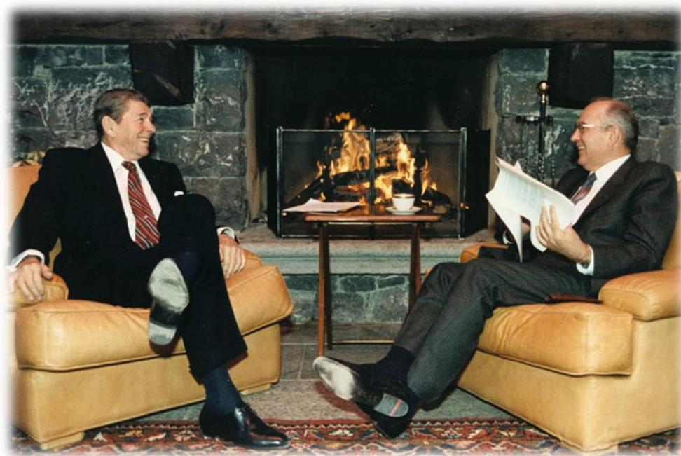
USA:s president Ronald Reagan och Sovjetunionens generalsekreterare Michail Gorbatsjov håller diskussioner i Genève, Schweiz, 1985.

Källa: Wikipedia 23/3 2017: https://sv.wikipedia.org/wiki/Kalla_kriget