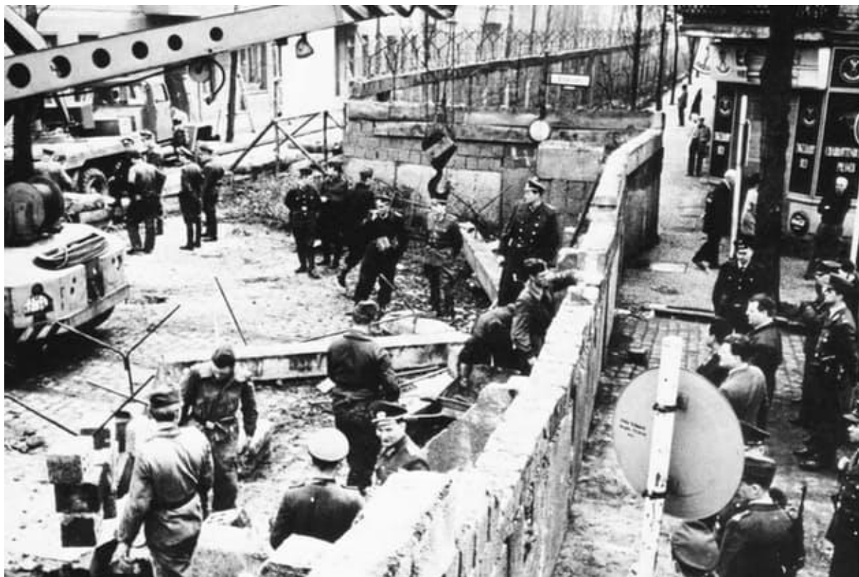
1961: Byggandet av Berlinmuren inleds

Under de följande tre åren skjuter en 15 kilometer lång mur upp, och 130 kilometer stängsel med 165 vaktorn kapslar in Västberlin. Familjer och vänner splittras av den ökända Berlinmuren, medan de som försöker fly ofta hamnar i ingenmansland som offer för vakternas kulor.