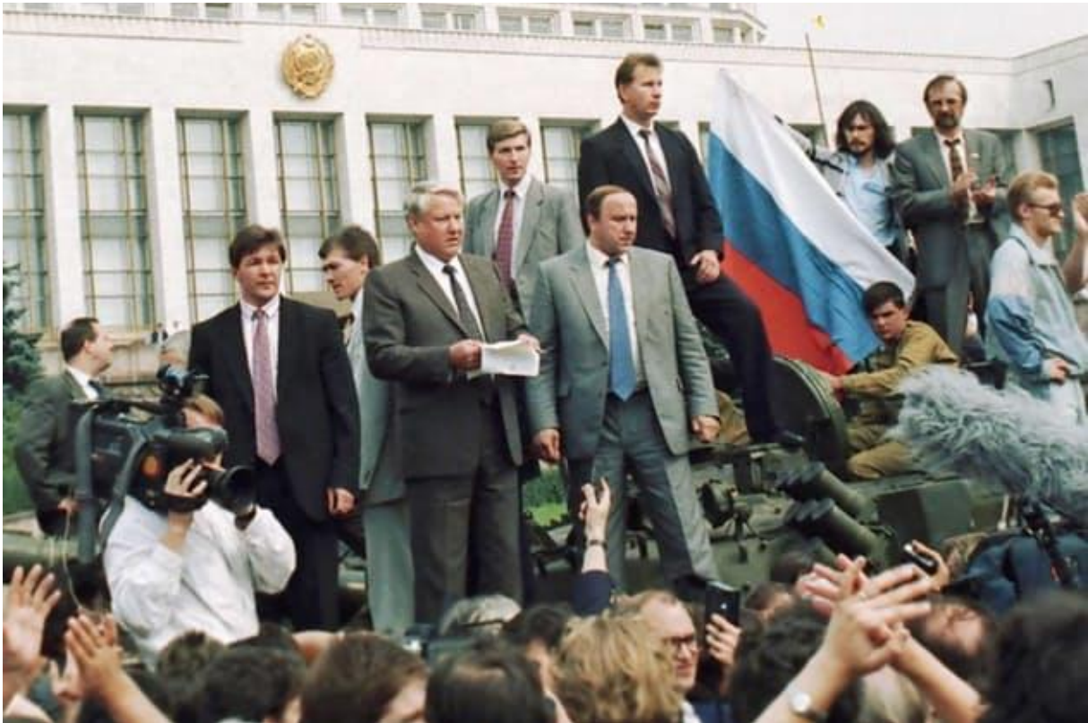
1991: Regimen i Kreml faller

Utan rädsla för sovjetiska repressalier vädrar frihetsrörelserna -morgonluft. I Leipzig tågar över 100 000 invånare genom gatorna under slagorden ”Ned med muren!”. Demonstrationerna fortsätter vecka efter vecka. I Polen dyker den fängslade fackföreningsledaren Lech Wałęsa upp i tv för att utmana systemet. Mindre än ett år senare rullar östtyska Trabant in i väst.