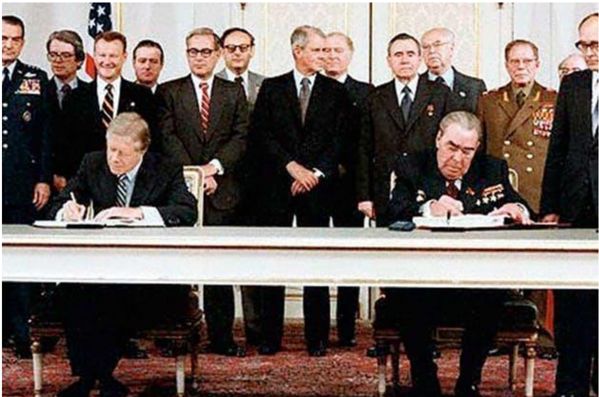
1979: SALT II-avtalet undertecknas

År 1972 möts USA:s president, Richard Nixon, och Sovjetunionens ledare, Leonid Brezjnev, i Moskva för att underteckna det första av två SALT-avtal, som begränsar ländernas kärnvapen, bombplan och ubåtar. Nästa avtal, SALT II, undertecknas 1979.