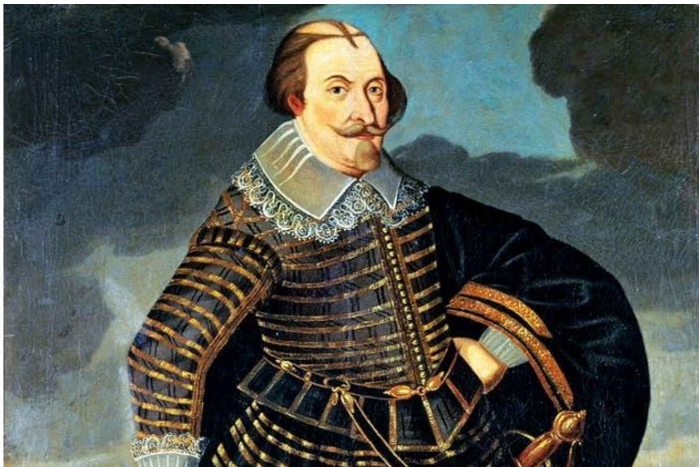
Karl styrde sitt hertigdöme (Värmland och stora delar av Sörmland och Närke) självsvåldigt.

Hertig Karl har betecknats som en företagarfurste, en merkantilist som ömmade för de egna territoriernas välgång. Därmed kom han att sätta en personlig prägel på det svenska kulturlandskapet, vilken än i dag är uppenbar för alla som färdas och vistas i landet.