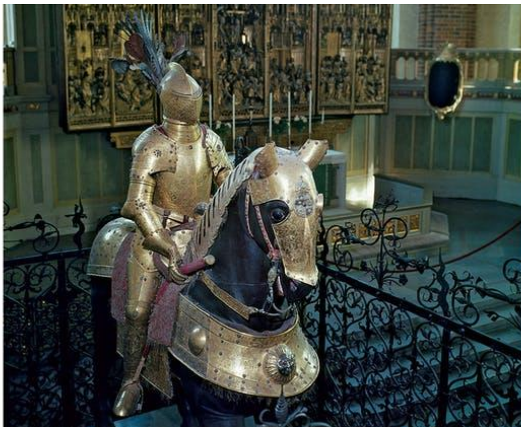
Karl IX dog i Nyköping 1611 och begravdes i Strängnäs domkyrka. Gravvården är krönt av häst och ryttare med förgylld kopparrustning.

Hur ska vi i dag tolka Karl IX? Samtidens bedömare var ense om att kungen var livsfarlig. I de skriftligt dokumenterade reaktioner som följde på nyheten om dödsfallet år 1611 framgår att folk gladde sig över att inte längre behöva riskera liv och lem när de yttrade sig offentligt. Samtidigt vet vi att Karl IX hade goda, eller åtminstone starka, sidor. Den durkdrivenhet och det kraftfulla agerande som möter oss både under hans tid som hertig och som kung är imponerande.