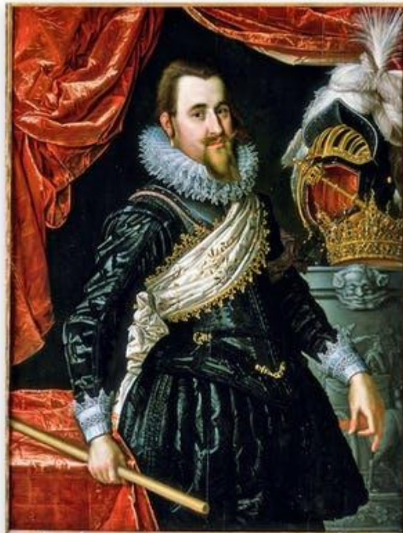
Den danske kungen Kristian IV angrep Sverige vilket ledde till Kalmarkriget

Nederlaget vid Kirkholm, sydöst om Riga, den 17 september 1605 räknas som en av de största motgångarna i den svenska krigsmaktens historia – Karl måste själv fly från slagfältet till häst för att inte dödas eller råka i fångenskap. Kungen hade dessutom svårt att finna allierade. Visserligen stöddes han på papperet stundom av England och Nederländerna, men i praktiken stod Sverige ensamt. Det faktum att Karl IX år 1609 lät sig lockas att dra in Sverige i det oroliga ryska kriget gjorde läget ännu allvarligare. Ryssland var försvagat och upplevde en era som brukar kallas ”den stora oredan”, eftersom olika tronkandidater kämpade om tsartiteln. Visserligen hade svenskarna framgångar och erövrade Kexholm och Novgorod 1611, men krigsansträngningarna gjorde landet sårbart, i synnerhet om Danmark valde att gå till angrepp. Detta var också vad som skedde.