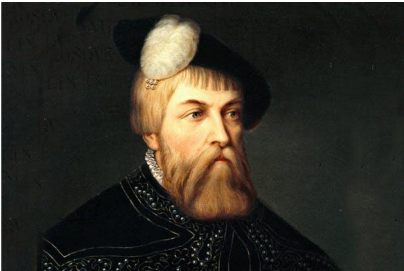
Gustav Vasa var far till Karl IX

Enligt en anekdot ska Karl ha öppnat kistan i slottskapellet, dragit den döde i skägget och konstaterat att huvudet inte skulle ha suttit säkert om mannen levte. Änkan Ebba ska då ha svarat: ” Om min salige herre levat, så hade Hans Nåd aldrig kommit här in. ” Dessvärre har händelsen förmodligen aldrig ägt rum, men tillsammans med de fullt historiska avrättningarna år 1599 säger den mycket om samtidens och eftervärldens syn på Karl, den mest hänsynslöse av Gustav Vasas söner.