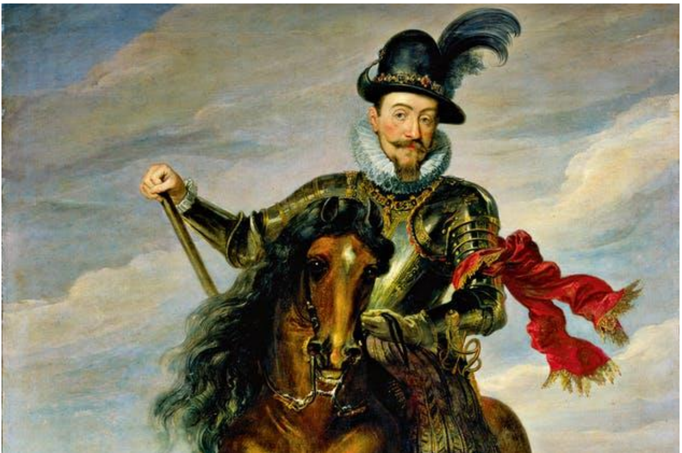
Johan III:s son Sigismund var kung i Polen och försökte behålla makten även i Sverige genom sina svenska ståthållare.

Frågan om hertigens maktposition ställdes på sin spets när Johan avled 1592 och efterträddes av Sigismund, som ju inte kunde regera i Sverige och Polen samtidigt. Efter utdragna diskussioner nådde rådsherrarna och Karl en kompromiss i januari 1593. Visserligen erkändes hertigen som riksföreståndare, men i praktiken fick rådsherrarna allt större inflytande över regeringen. Under Sigismunds personliga vistelse i Sverige 1593–1594 ägde intensiva förhandlingar mellan parterna rum, men utan att konflikten löstes. De år som följde kännetecknades därför av en allt intensivare kamp mellan hertig Karl, rådsherrarna och kungen, som trots att han befann sig i Polen försökte behålla makten i egna händer via svenska ståthållare.