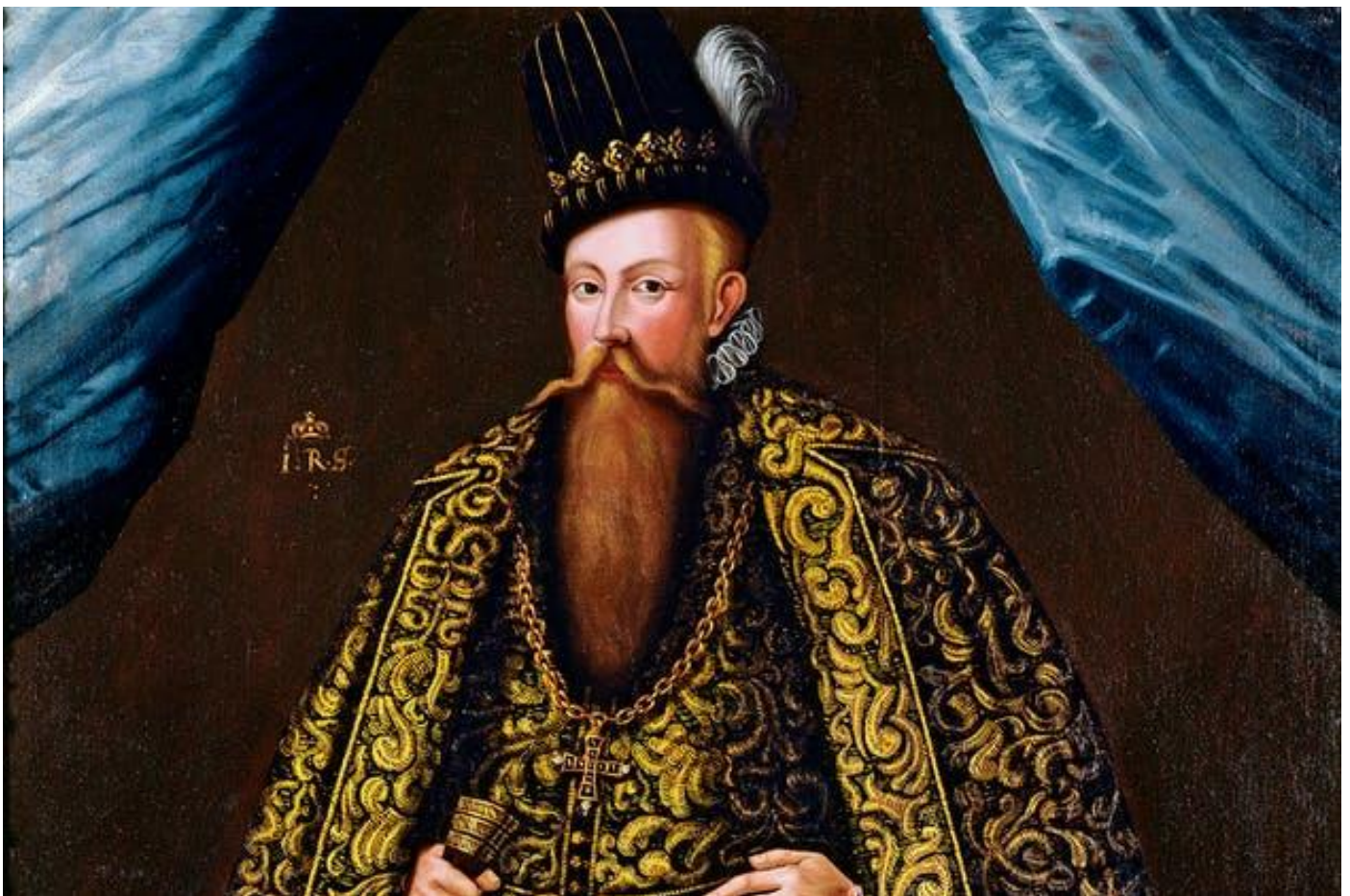
Karl var ibland allierad med, ibland i luven på, sin bror Johan III.

Hertigen styrde och ställde efter eget gottfinnande med sina biskopar och präster. År 1583 lät han i praktiken dela Skara stift i två delar genom att tillsätta en superintendent i Mariestad – en föregångare till dagens biskop i Karlstad.