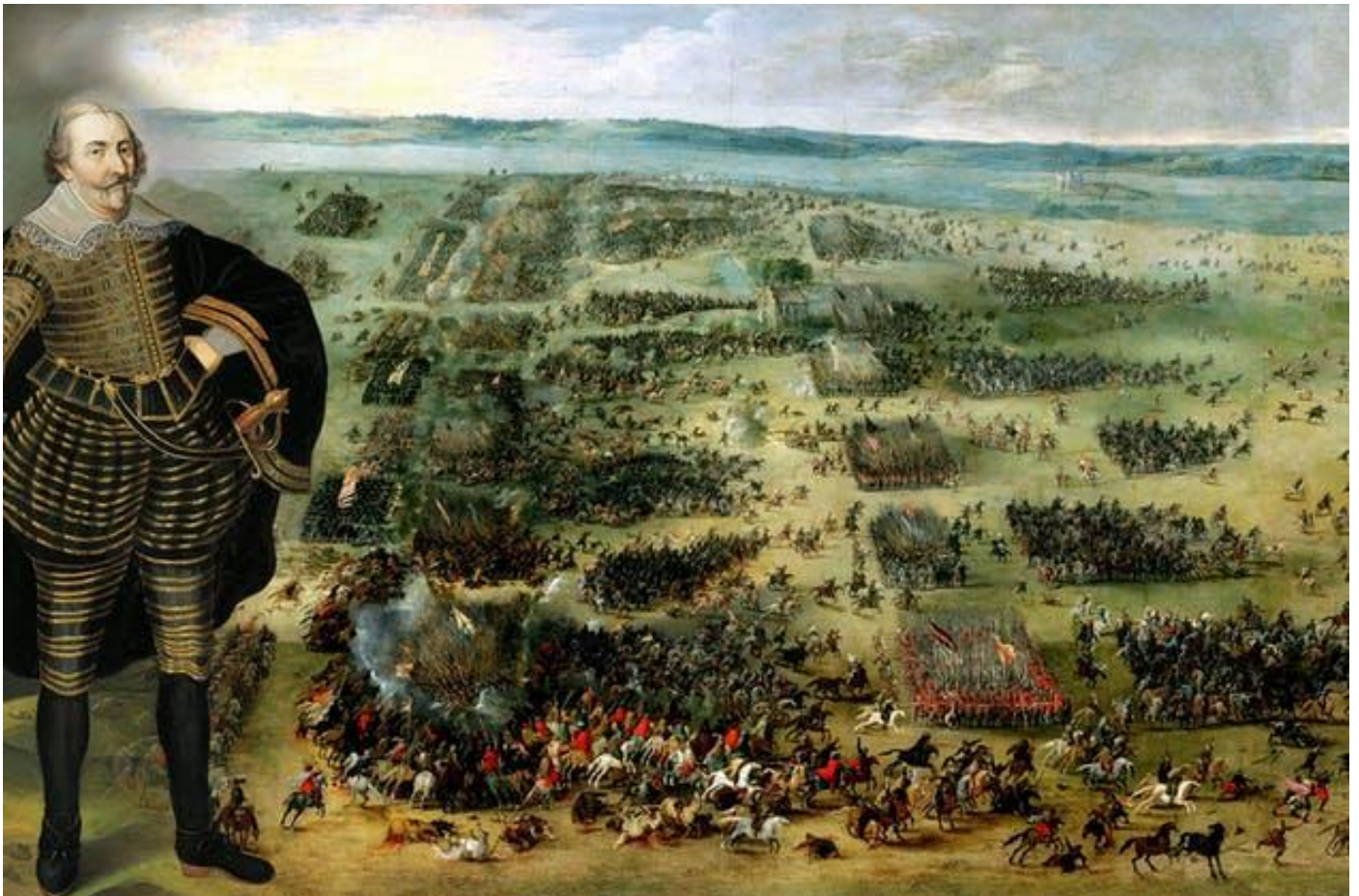
Karl IX råkade ut för en av Sveriges värsta förluster i slaget vid Kirchholm 1605.