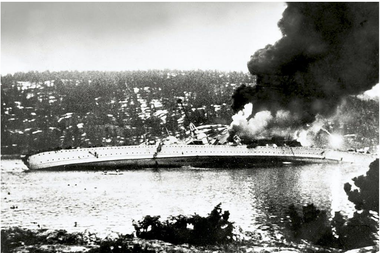
Den tyska tunga kryssaren Blücher brinner i Oslofjorden efter två torpedträffar. Fotot är taget från fästningen Oscarsborg

Att ladda om skulle inte vara möjligt, för detta behövdes kompletta besättningar. Det kunde bara bli tal om två skott, men när dessa avlossades på kort avstånd klockan 04.21 blev det två fullträffar. Blücher blev genast manöveroduglig. Bränder lyste upp fartyget och blandades med mynningsflammar från fler, mindre batterier runt Oslo. Kryssaren hade besvarat elden och när det inte längre sköts från Oscarsborg trodde man för ett ögonblick att operationen kunde fortsätta bara Blücher återfick styrförmågan. Men snart var fartyget inom skotthåll från torpedbatteriet på norra Kaholmen. Två nya explosioner överröstade dånet från artilleriet i Oslofjorden, följt strax därpå av en smäll högre än alla andra när en ammunitionsdurk sprang i luften. Blücher kastade ankar utanför Askholmarna. Två timmar senare kantrade hon och sjönk. Fartyget tog cirka 1 000 av sina 2 400 man med sig i det iskalla vattnet. Resten av besättningen och de ombordvarande armésoldaterna lyckades rädda sig i land. De kvarvarande örlogsfartygen hade redan vänt och seglat söderut. Det sjöburna anfallet mot Oslo hade misslyckats och hoppet stod nu till fallskärmsjägarna som skulle anfälla Fornebu.