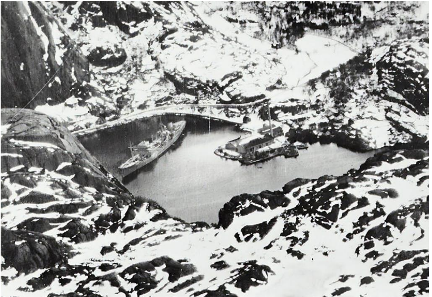
Det tyska transportfartyget Altmark ligger förtöjd i Jössingfjord. Fotot är taget av ett brittiskt spaningsplan innan jagaren Cossack fritog de brittiska krigsfångarna.

Under hösten 1939 visade Hitler ringa intresse för Skandinavien. Han fokuserade på det kommande anfallet i Västeuropa, som han ville inleda kort efter fälttåget i Polen. Påstötningar från chefen för den tyska flottan, amiral Raeder, som menade att Tyskland behövde marinbaser i Skandinavien gjorde inget direkt intryck på Führern. Under vintern 1939–40 inträffade dock tre händelser som hade stort inflytande på Hitlers beslut. Den första viktiga händelsen var det sovjetiska anfallet på Finland i slutet av november 1939. Därmed drogs Norden in i storkriget. Den andra inträffade i januari 1940, då en tysk officer nödlandade i Belgien med en portfölj full med känsliga dokument rörande de tyska anfallsplanerna för Västeuropa. Denna incident, i kombination dels med dåligt väder, dels med behov av tid för förberedelser av armén, kom att leda till att tyskarna sköt upp det planerade anfallet till maj 1940. Slutligen inträffade i februari 1940 den så kallade Altmarkincidenten.