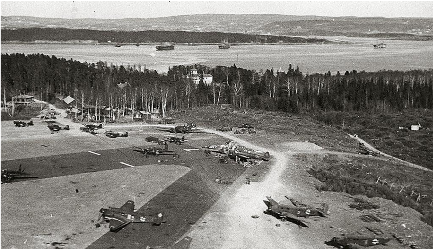
Flygfältet Fornebu utanför Oslo sedan tyskarna tagit över det. I förgrunden står transportplan av typen Junkers Ju 52/3 och på landningsbanan Heinkel He 111 bombplan. Längst bort står fem Junkers Ju 87R.

Om de två första satts in mot Fornebu direkt skulle de ha kunnat återta fältet. Ett av dessa skickades emellertid i bussar för att ta hand om de tyska soldater som tagit sig i land från Blücher och när man en stund senare insåg att tyskarna landsatt trupper på Fornebu fanns ingen transport för det kompani som var kvar i huvudstaden. I all hast försökte man ordna nya fordon.