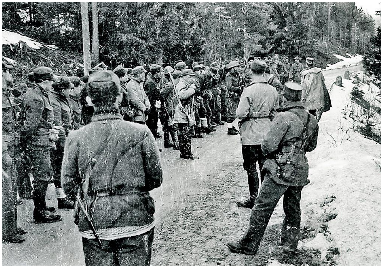
En grupp norska soldater tar paus i april 1940.