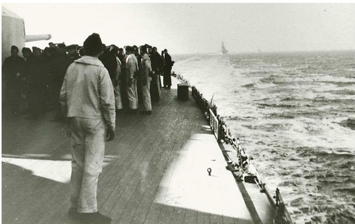
Den tyska kryssaren Blücher (Admiral Hipper-klass) på väg mot Norge inför invasionen.

I början av april samlades tyska arméförband i hamnar längs Östersjökusten och Nordsjökusten. De kom dels från den 3. bergsdivisionen, dels från infanteridivisioner som inte deltagit i Polen. Merparten av enheterna i de sistnämnda var nyligen uppsatta. Soldaterna hade ingen aning om varför de förts till hamnarna. Då man inte ville riskera att röja den kommande operationen hade förbanden inte ens fått någon utbildning eller övning i landstigningsoperationer. Eftersom avståndet mellan de olika tyska hamnarna och målen varierade stort avseglade inte alla styrkor samma dag. I stället lämnade de tyska krigsfartygen sina hemmahamnar vid olika tidpunkter och satte efter ett noggrant utarbetat schema kurs mot den norska kusten. Sammanlagt rörde det sig om sex kryssare, 14 jagare samt ett antal transportfartyg och mindre örlogsfartyg. Det mulna vädret ökade chanserna att undgå upptäckt och när väl fartygen nått ett stycke ut på havet informerades armésoldaterna om sitt kommande uppdrag.