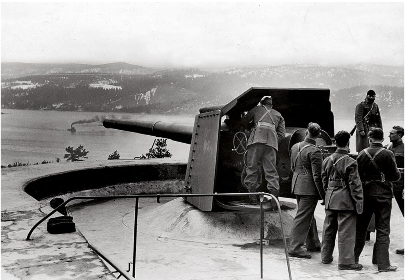
Den 18 april var södra Norge ockuperat och tyskarna började ta över de norska kustforten. Här tvingas norska artillerister instruera tyska soldater om kanonernas funktion.

I all hast bröt man upp och fortsatte flykten till Elverum. Där fortsatte samtalen om vad som bäst borde göras. Man enades om att motståndet måste fortsätta. Därefter var det dags att bege sig till Nybergssund vid svenska gränsen, för mörkret hade fallit och tyskarna närmade sig nu Elverum. I avsikt att stoppa dem hade man ett kompani gardesrekryter samt 20 officerare och underofficerare. Detta förstärktes med ett antal män ur lokala skytteklubben samt medlemmarna i en gasövningskurs. De som inte hållit i ett gevär tidigare fick en kurs på tio minuter. Sedan placerade man ut försvaret på ömse sidor av vägen. Normännens starkaste kort var två vattenkylda kulsprutor. Med denna styrka skulle man hejda 100 välutbildade tyska fallskärmssoldater, utrustade med kulsprutor, kpistar och handgranater. Bakhållet fungerade inte. Innan tyskarna nådde upp till den barrikad man placerat över vägen, anlände ett antal civila fordon som övergavs på vägen. När Spiller väl dök upp stannade de så långt ifrån positionen att kulsprutorna inte hade skottfält och striden inleddes på ett längre avstånd än vad som varit tänkt.