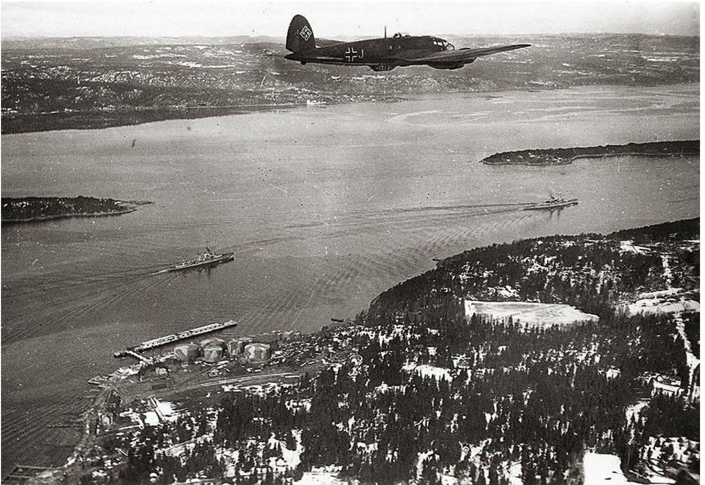
Det tyska anfallet på Norge 1940 var första gången som armé-, sjö- och flygstyrkter samverkade i en större operation. På bilden följer en Heinkel He 111 kryssarna Lützow och Emden in i Oslofjorden den 10 april.

Hitler gav order om att Norge i april 1940 skulle erövrats i ett överraskningsanfall. Det var avgörande för Tyskland att hinna före de allierade till den viktiga hamnen i Narvik. Mot ett passivt norskt försvar, flera tillfälligheter och med mycket tur gick planen i lås.