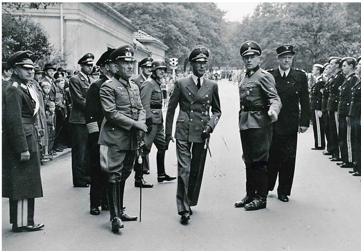
General Nikolaus von Falkenhorst (stödjer sig på värjan) ledde operation Weserübung. Här syns han tillsammans med rikskommissarie Josef Terboven (mitten) och ministerpresident Vidkun Quisling (mörk uniform till höger).

Det fanns också en aspekt som kanske inte var så framträdande i själva planläggningen, men som skulle visa sig betydelsefull under den kommande operationen. Under denna skulle det flera gånger visa sig att det tyska luftherraväldet upphävde det brittiska sjöherraväldet, något som också var en milstolpe i krigföringens historia. Luftwaffes framträdande roll var också ett av de viktigaste skälen till att även Danmark skulle angripas. Vid Ålborg fanns goda flygfält som skulle vara mycket värdefulla för tyskarna om de erövrades snabbt. Arméförband skulle korsa Danmarks sydgräns och snabbast möjligt köra rakt norrut, medan sjöburna förband sändes mot nyckelpunkter på de danska öarna, däribland Köpenhamn.