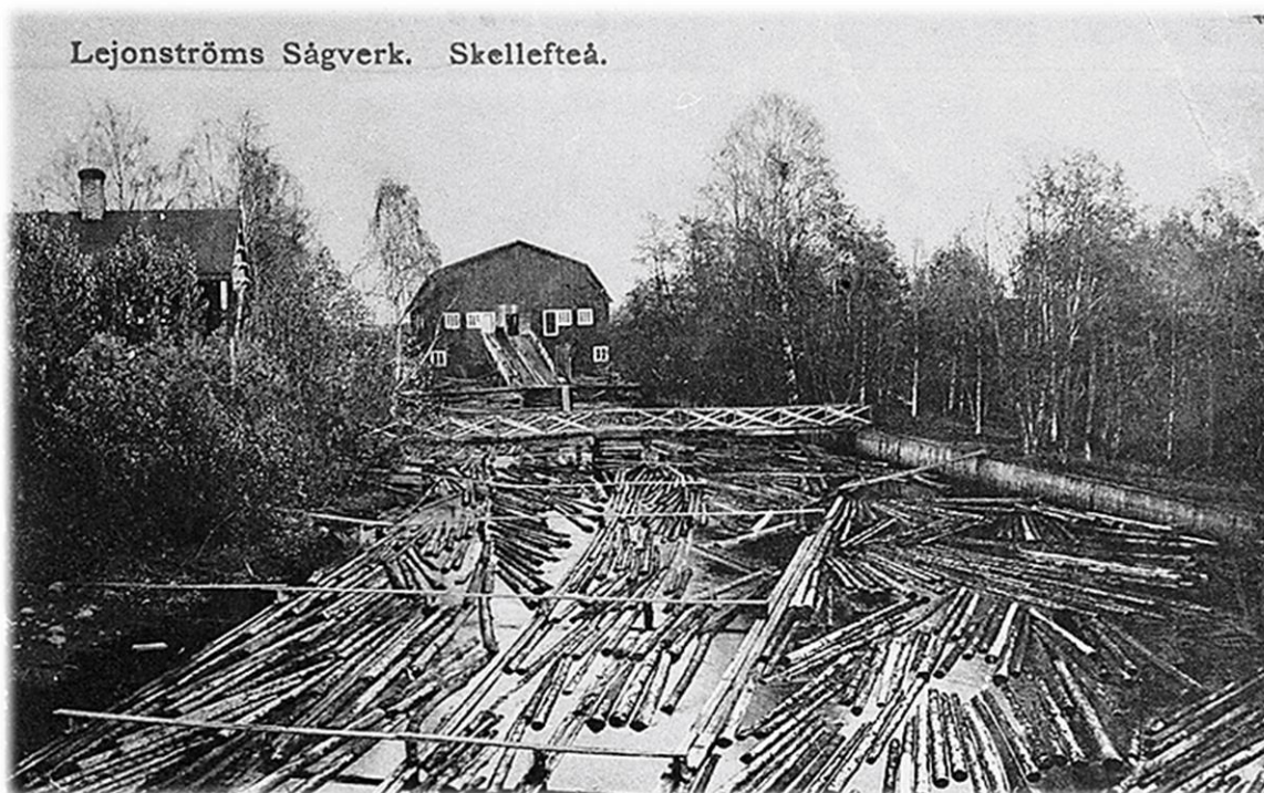
Bild: Lejonströms sågverk, Skellefteå