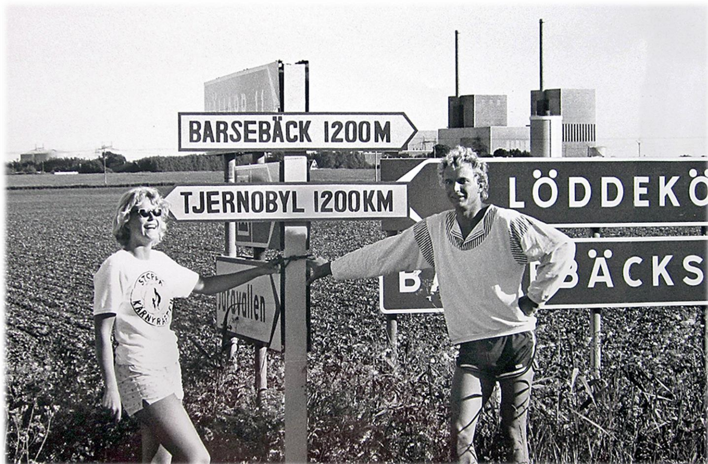
Miljöaktivister utanför Barsebäckverket 1986.