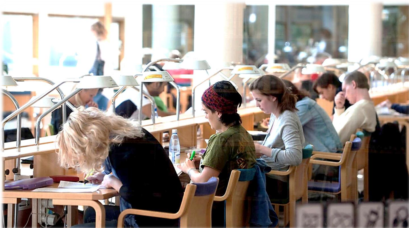
Örebro läns museum