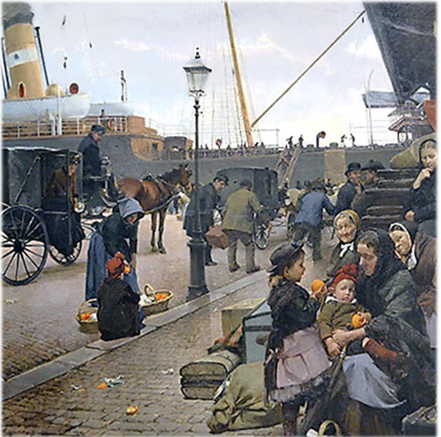
Bild: Emigranter som väntar på att gå ombord på atlantångaren som ska ta dem över till USA. Målningen av Edvard Petersen, 1890.