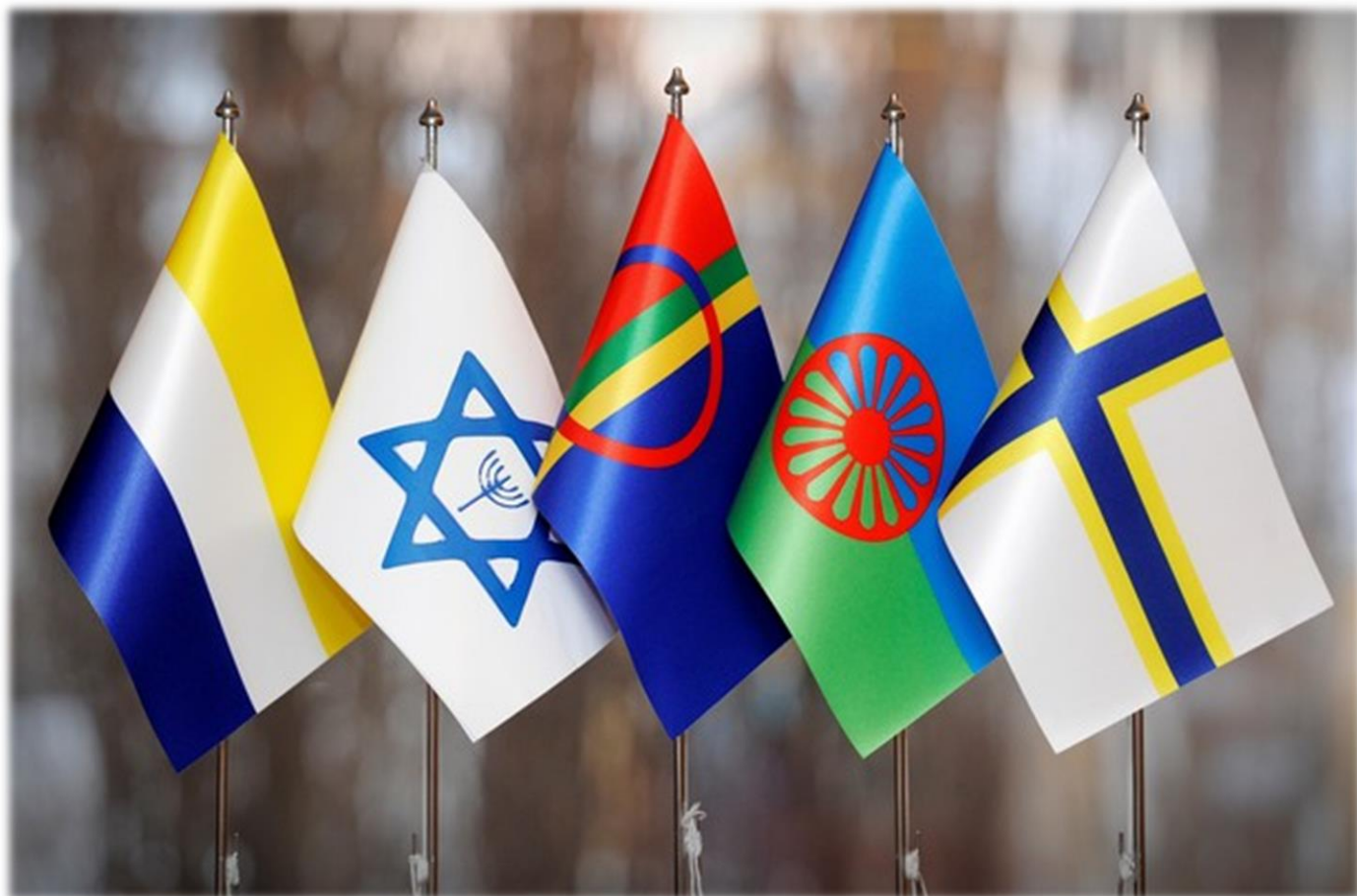
Bild: Flaggorna för dagens nationella minoriteter i Sverige. Från vänster: tornedalingar, judar, samer, romer och sverigefinnar.