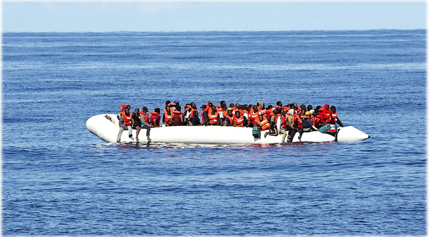
Bild: Flyktingar på medelhavet på väg mot Europa.