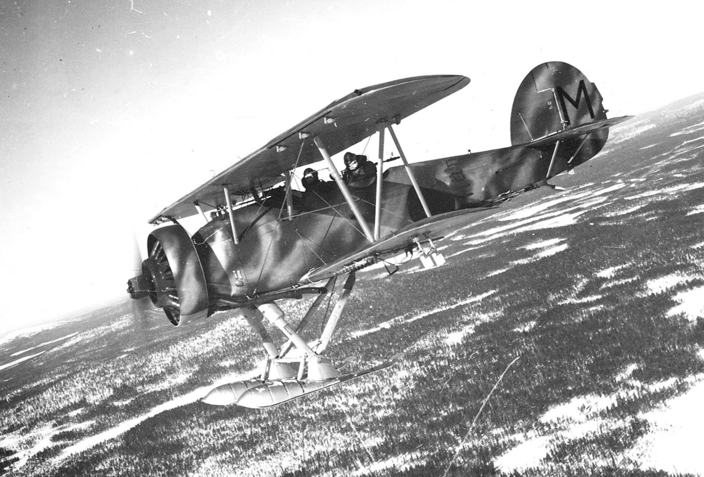
Svenska flygvapnet 1930-tal