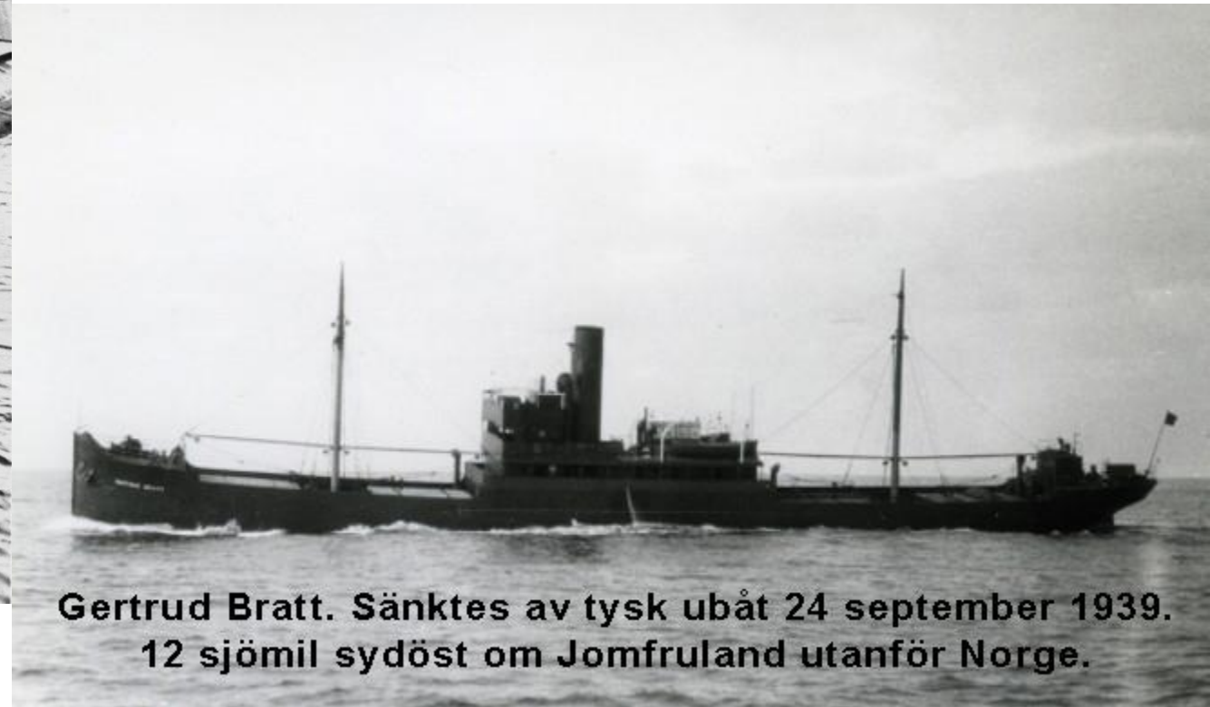
Gertrud Bratt. Sänktes av tysk ubåt 24 september 1939. 12 sjömil sydöst om Jomfruland utanför Norge.