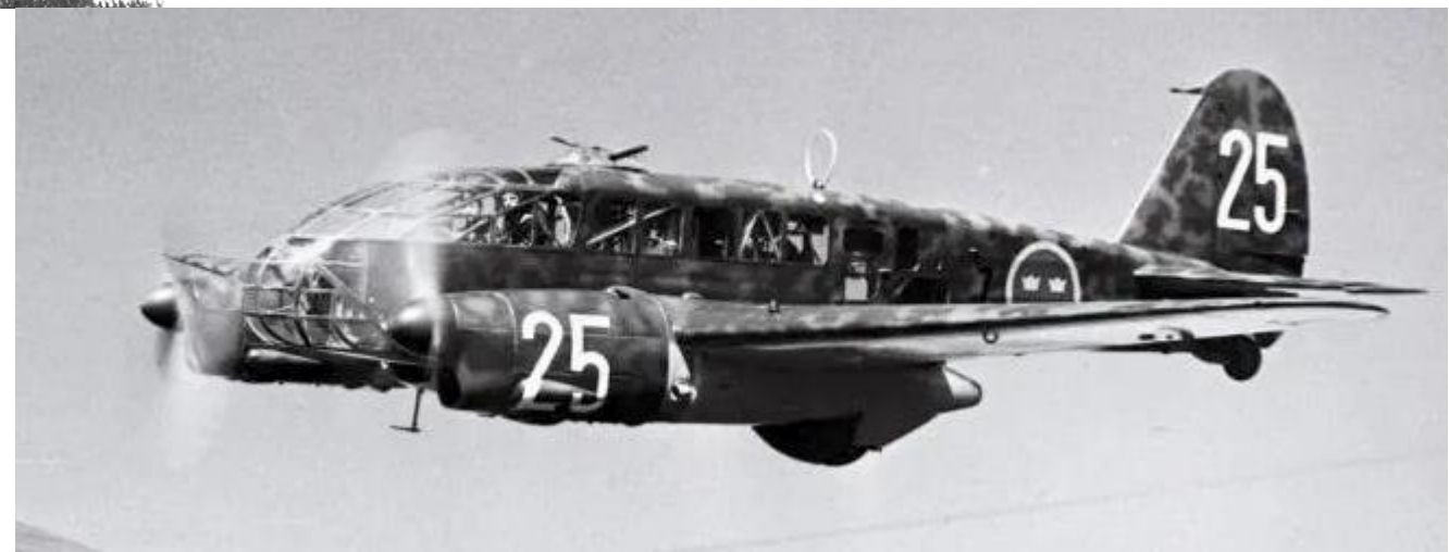
Italienska flygplanet B-16 Caproni