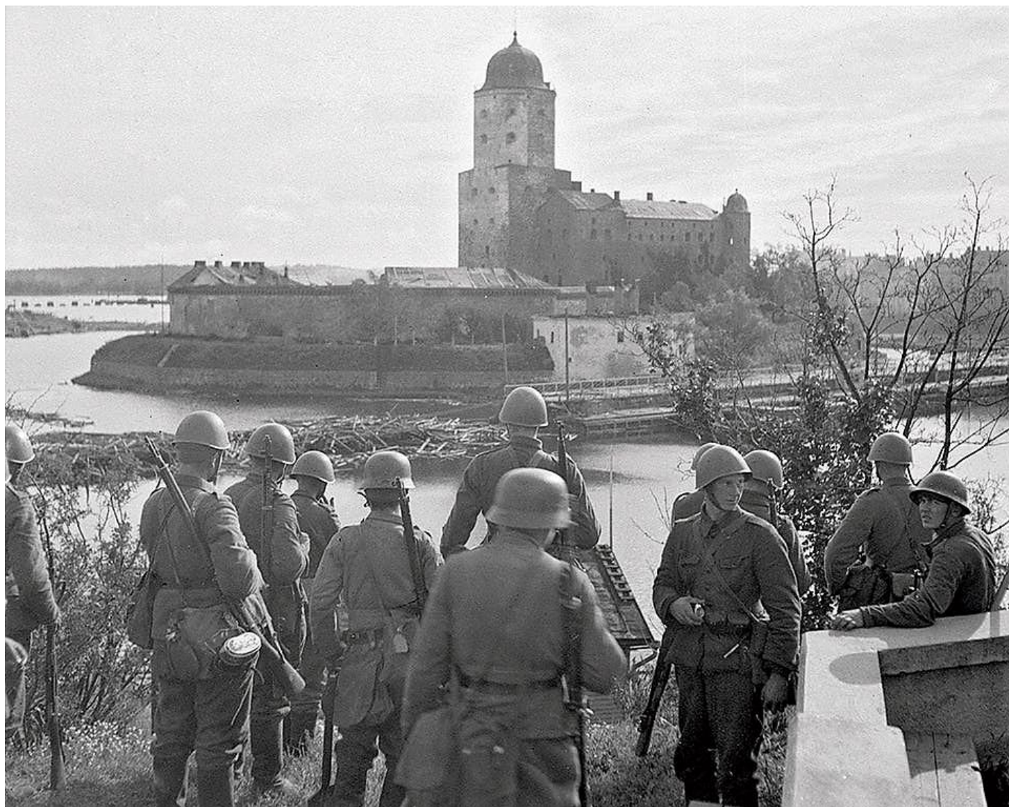
Viborg var västra änden på VKT-ställningen som var den sista försvarslinjen på Karelska näset. Staden lämnades dock av sina finska försvarare nästan helt utan strid den 20 juni. Foto från 1941.

Väl framme i frontlinjen konstaterade soldaterna att det var mycket lite försvarsförberedelser gjorda vid det 50–300 meter breda vattendraget där de sovjetiska förbanden stod på andra sidan. Försvararna fick ett dygn på sig att under fientlig störningseld försöka befästa den omväxlande steniga och vattensjuka marken.