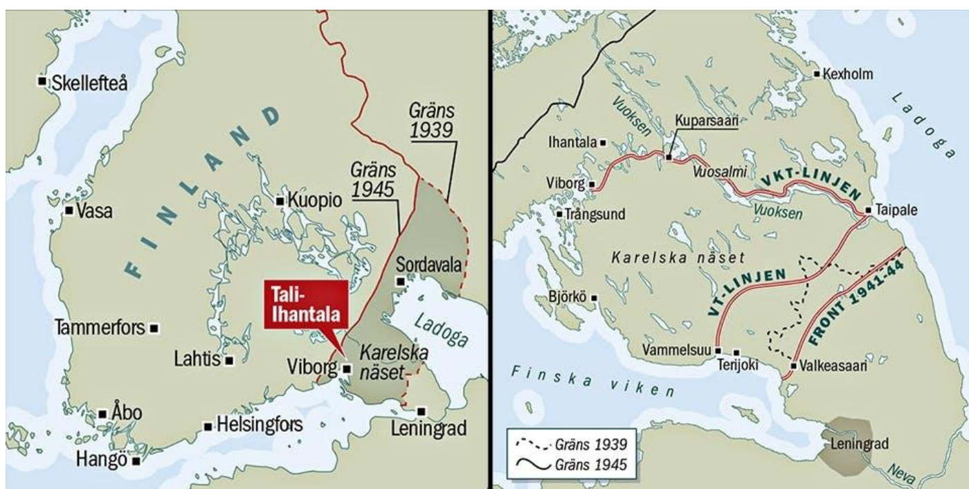
Till vänster översiktskarta med gränsen mellan Finland och Sovjetunionen 1939 och 1945. Till höger de tre finska försvarslinjerna inför det sovjetiska anfallet på Karelska näset 1944. © Erik Lindholm

Dagen därpå sattes den sovjetiska offensiven in med full kraft med ett artilleriunderstöd om ungefär 6 000 pjäser – ett eldrör på varannan frontmeter! Storanfallet bröt genast igenom den första försvarslinjen och drev inom några dagar även ut finnarna ur den andra. Därefter följde fram till den 20 juni en finsk reträtt under strid till VKT-linjen i höjd med Viborg. Samtidigt anlände nya finska trupper från fronten öster om sjön Ladoga, där man nu inlett ett allmänt återtåg.