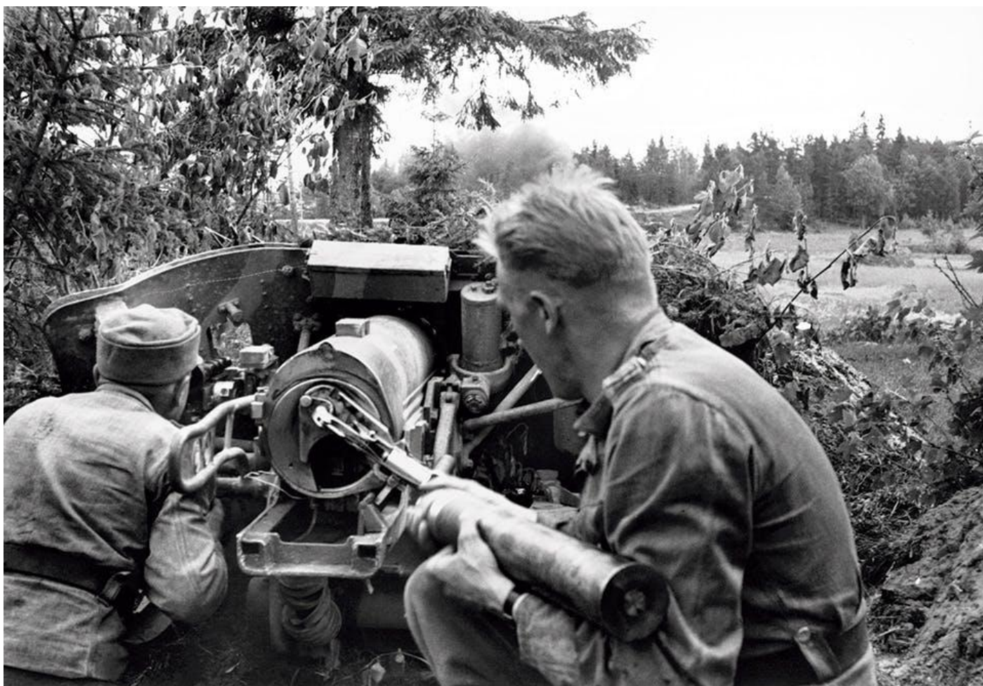
Finska soldater med en 7,5 cm Pak 97/38 pansarvärnskanon. Dessa var franska fältkanoner som byggts om i Tyskland.

Sedan försöken att avsnöra den sovjetiska inbrytningen getts upp måste de finska förbanden dras tillbaka ungefär tre kilometer till en ny linje. De var tvungna att, i fullständigt uttröttat tillstånd, genomföra en av de svåraste operationer som finns: att retirera under kontinuerlig stridskontakt och ständiga inringningshot. De finska styrkorna klarade eldprovet med ett nödrop. Inom ett dygn var grupperingen i den nya försvarslinjen klar. De akuta krissituationerna hade avvärdats, nedslitna enheter hade lösgjorts och dragits tillbaka för reorganisation och linjen var bemannad med de sista ännu stridsdugliga förbanden.