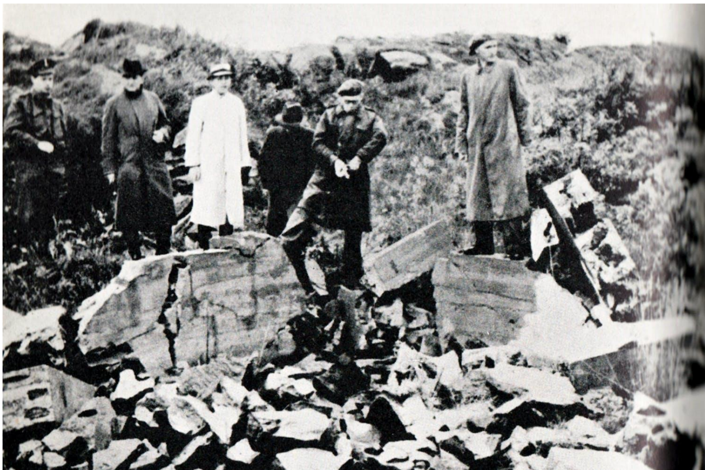
I maj 1945 besökte pressen ruinerna av Telavåg.