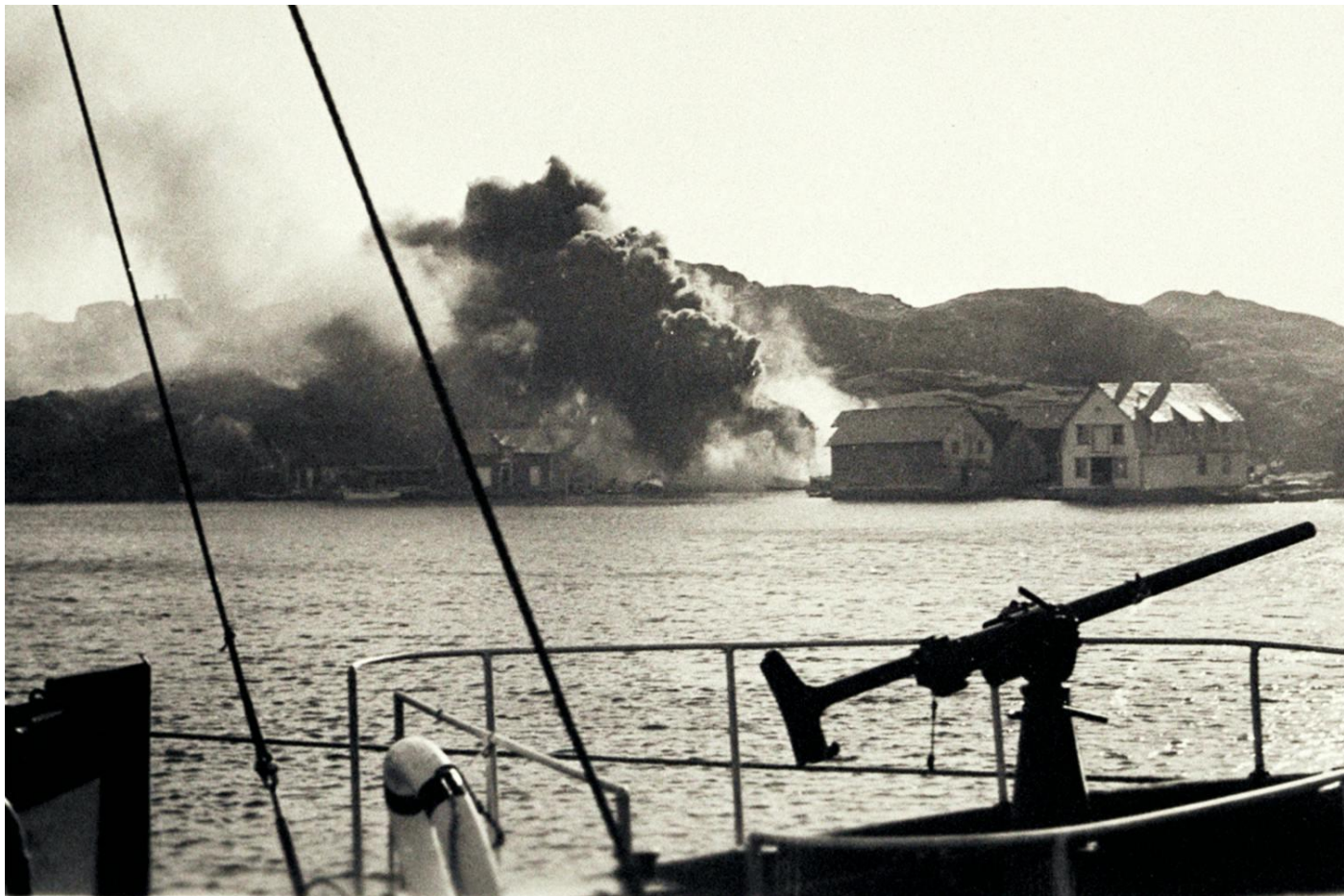
Husen i Telavåg sprängdes av den tyska ockupationsmakten.

Under andra världskriget var Telavåg utanför Bergen utskjppningshamn för flyktingar och samlingsplats för hemliga agenter. När de tyska ockupationsmyndigheterna fick nys om detta straffades samhället skoningslöst.