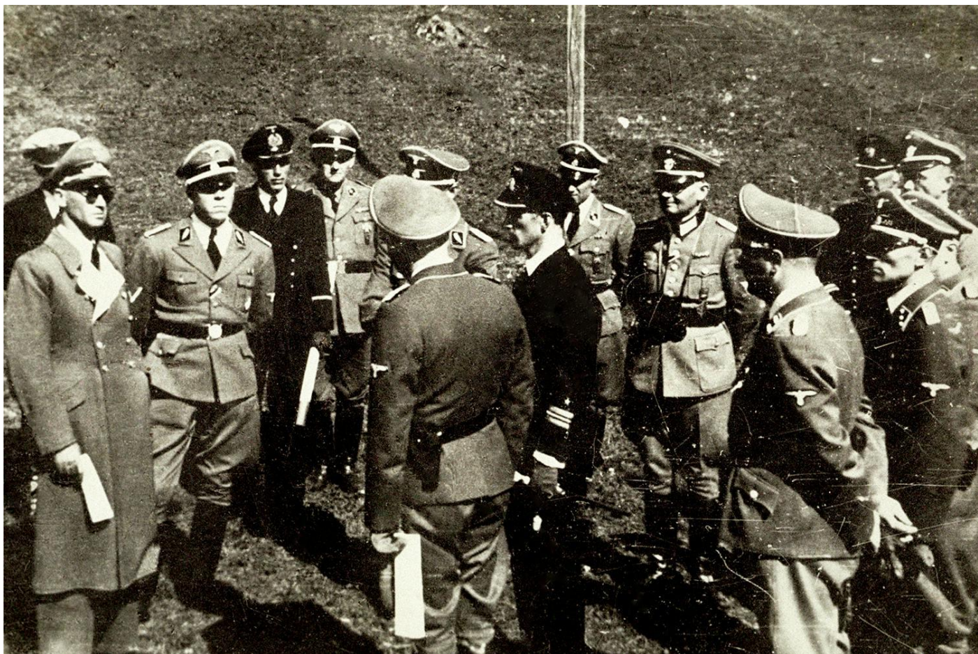
Rikskommissarie Josef Terboven (i solglasögon) kom till Telavåg torsdagen 30 april 1942. Samma dag började tyskarna spränga husen i den lilla fiskebyn.