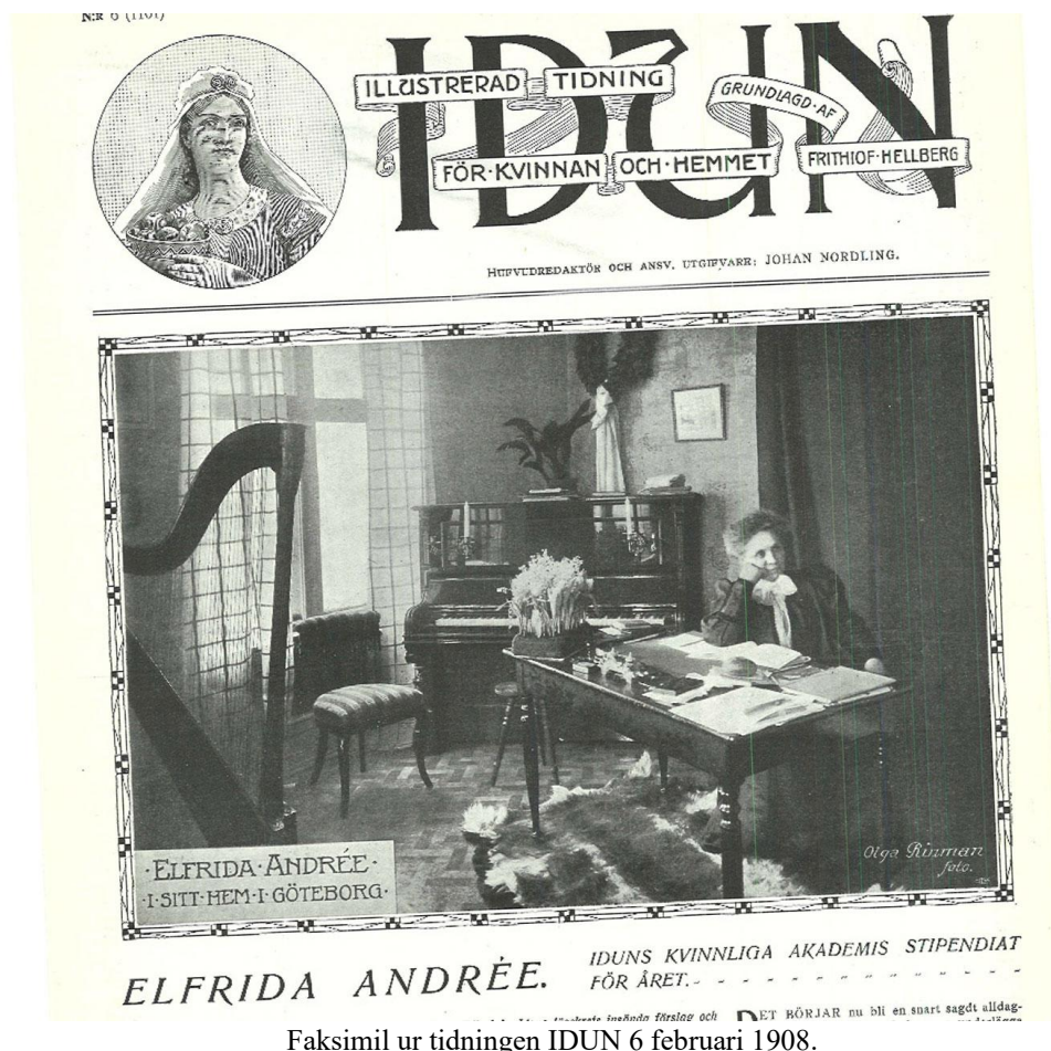
Faksimil ur tidningen IDUN 6 februari 1908.

Det blev orgelstudier vid musikkonservatoriet som bara något år tidigare börjat ta emot kvinnliga studenter. Två år senare blev hon den första kvinnan i Sverige som tog organistexamen! Men till vilken nytta? Kvinnor kunde inte få arbete som organister förrän en lagändring fyra år senare gjorde det möjligt. Det innebar naturligtvis inte att kvinnliga organister därefter togs emot med öppna armar! Motståndet var massivt från konservativt kyrkohåll. Det ansågs mycket olämpligt att ha en ensam kvinna sittande på orgelläktaren. Och aposteln Paulus hade ju sagt att "kvinnan tige i församlingen" . I Finska reformerta kyrkan i Stockholm fick hon till slut en första anställning. Under tiden hade hon utbildat sig till telegrafist, även det ett yrke enbart öppet för män. Hon hade trots det hunnit med mycket på kort tid och var redan känd i Norden för sitt yrkesval och sitt politiska arbete.