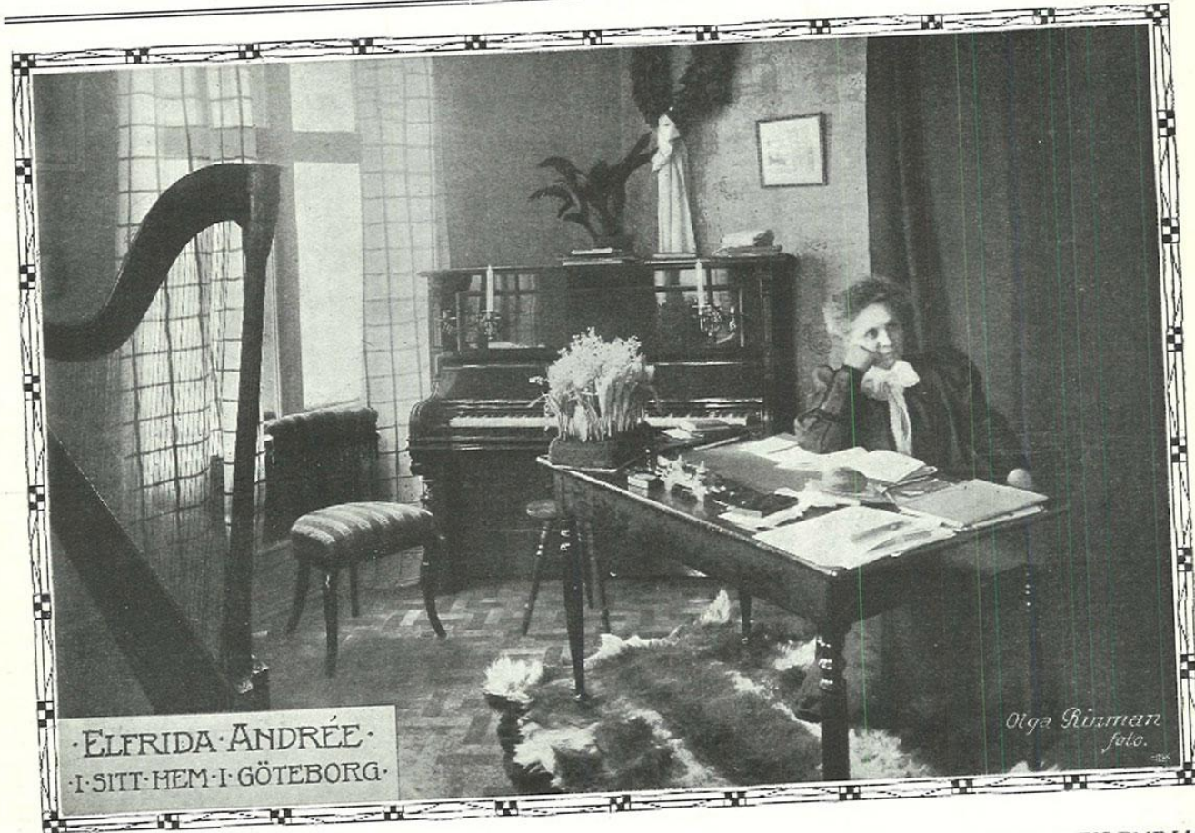
ELFRIDA ANDRÉE I SITT HEM I GÖTEBORG.