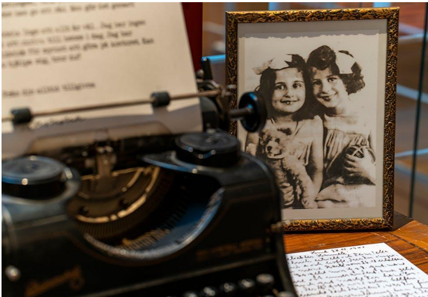
Utställningen "Jag kom ensam" visas på Forum för levande historia till den 1 september.

500 judiska barn fick en fristad undan nazismen i Sverige. Det är den utställningen ”Jag kom ensam” uppmärksammar.