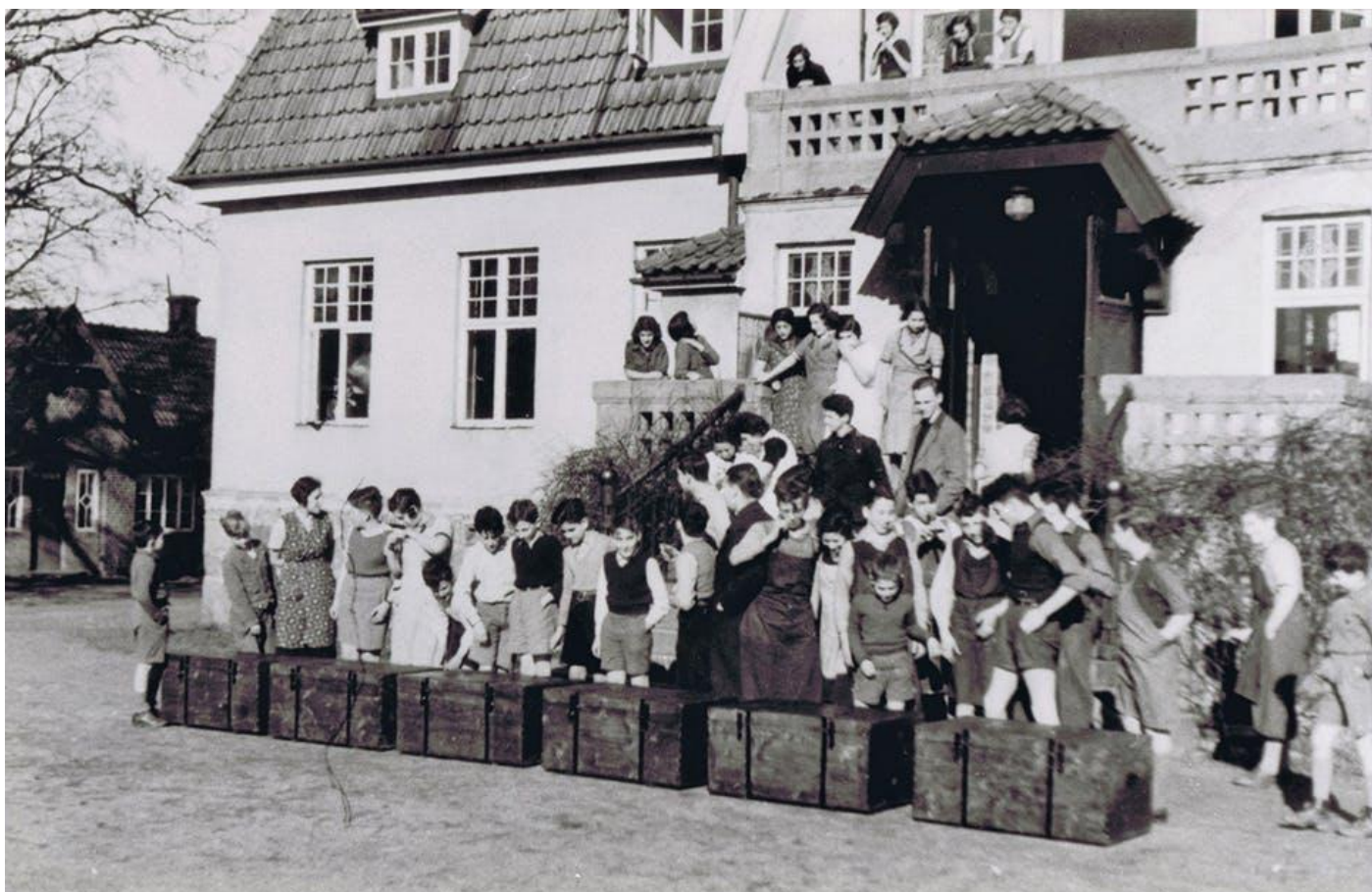
Ungdomar som var inkvarterade i ett kollektiv i skånska Västraby gör sig klara för att resa till Palestina/Israel sommaren 1940.