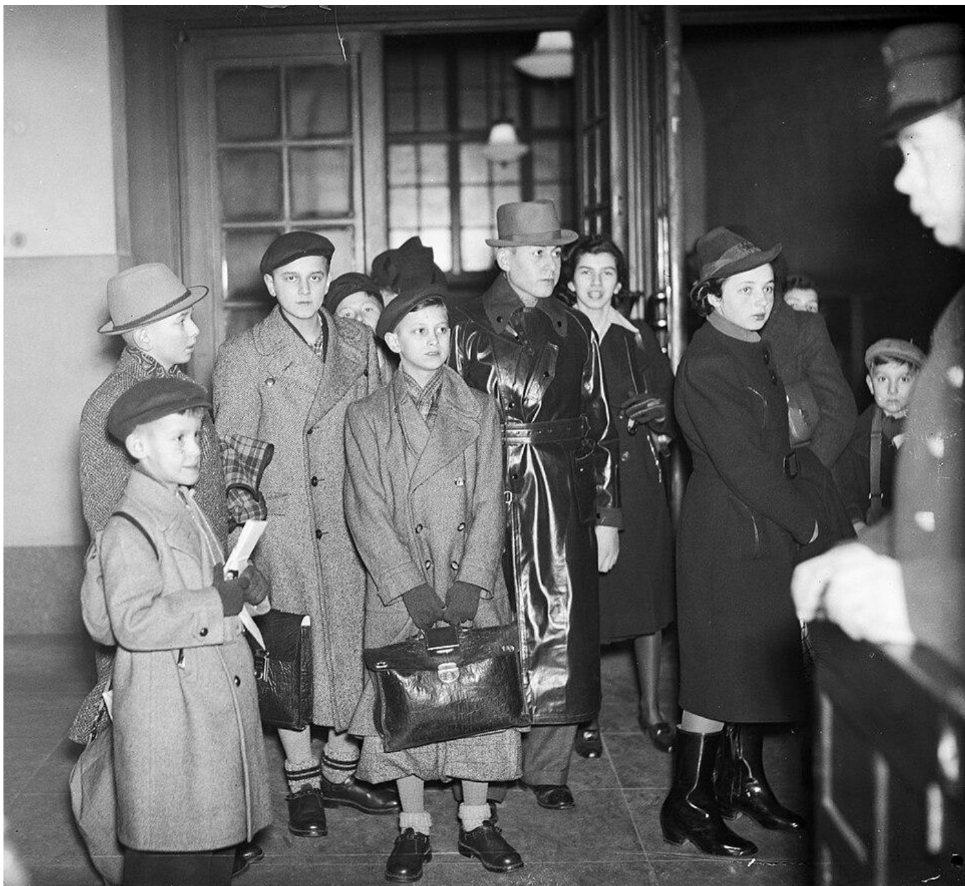
Judiska flyktingbarn som anländer till Stockholm 1939.

barnkvoten. Ett okänt antal av barnen som blev räddade via Kindertransport till länder som exempelvis Holland, Belgien och Frankrike föll offer för förintelsen då dessa länder senare blev ockuperade av Tyskland.