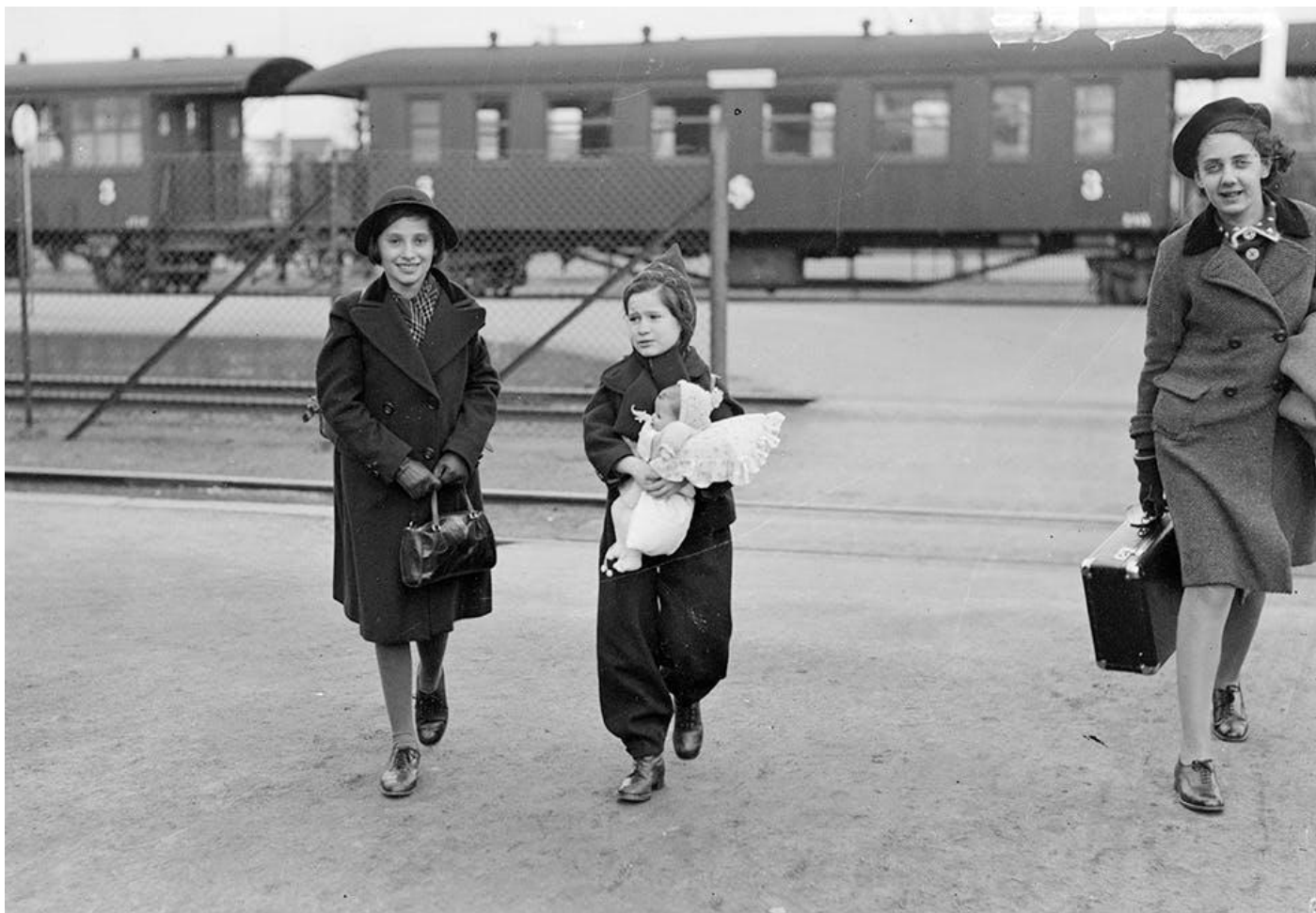
Judiska flyktningbarn på centralstationen i Göteborg i mars 1939. De var en del av programmet Kindertransport som fördelade barnen över flera länder i Europa.