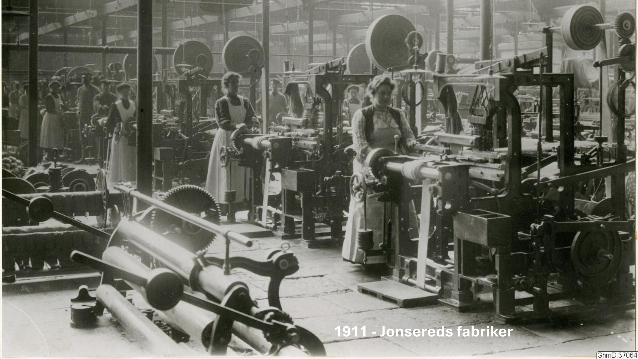
1911 - Jonsreds fabriker