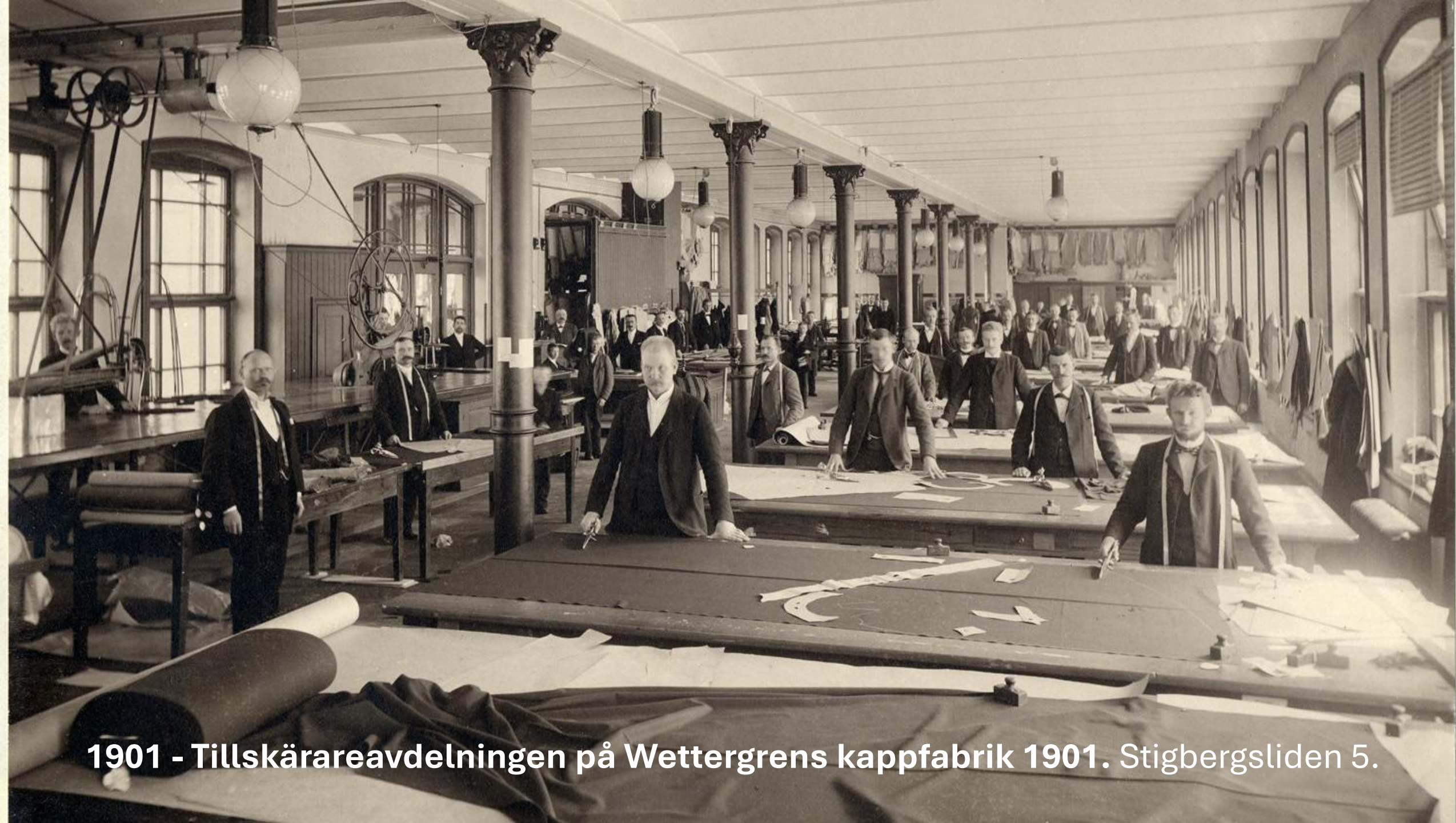
1901 - Tillskärareavdelningen på Wettergrens kappfabrik 1901. Stigbergsliden 5.