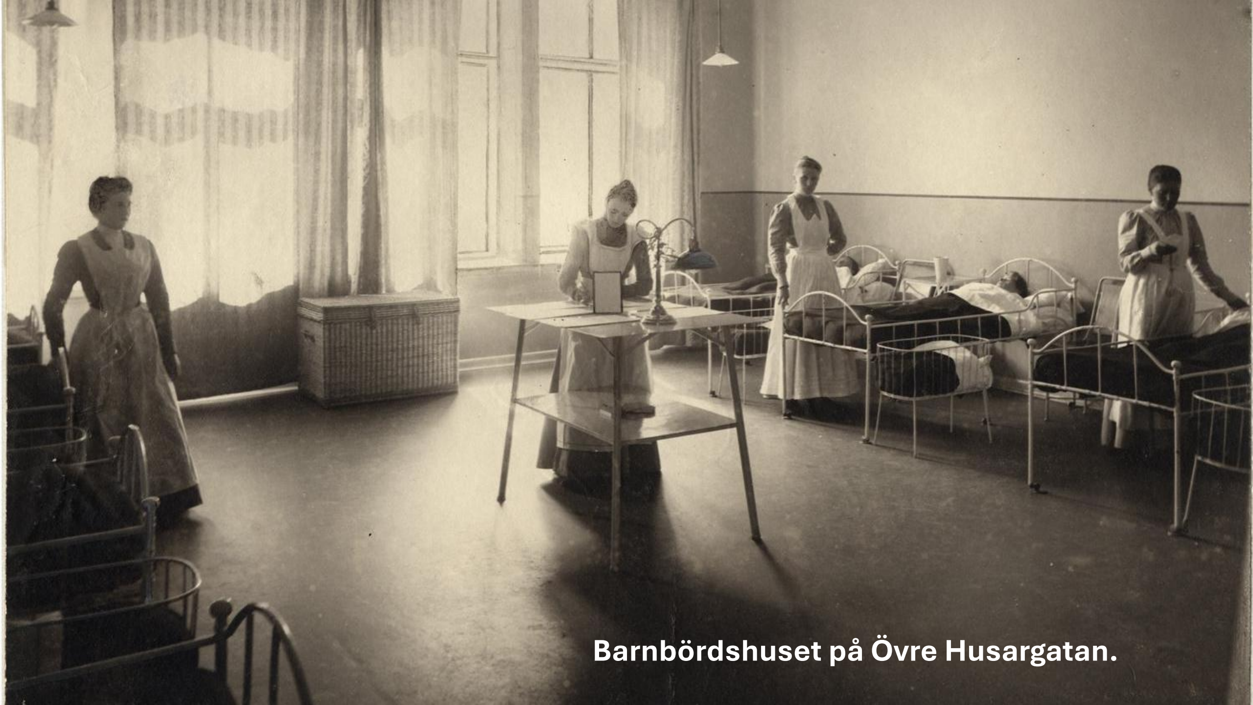
Barnbördshuset på Övre Husargatan.