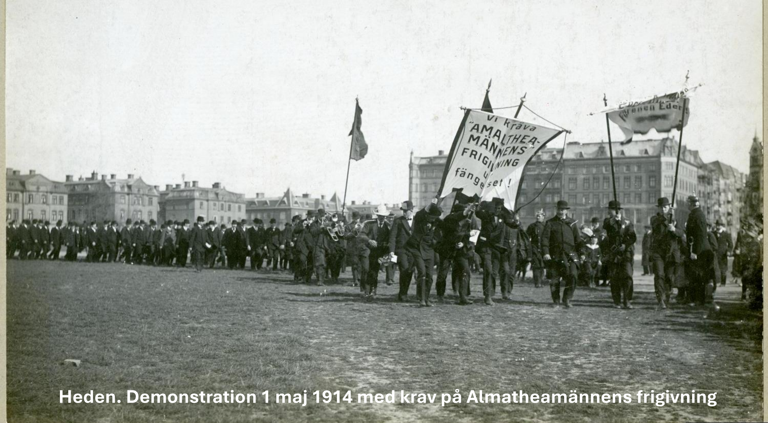
Heden. Demonstration 1 maj 1914 med krav på Almatheamännens frigivning