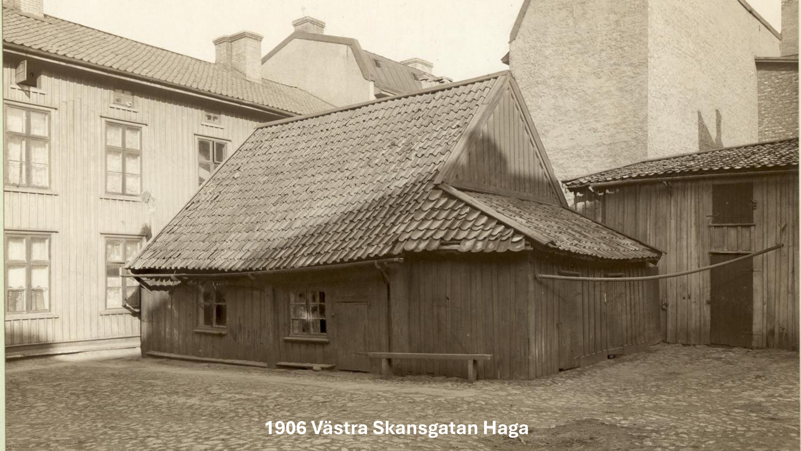
1906 Västra Skansgatan Haga