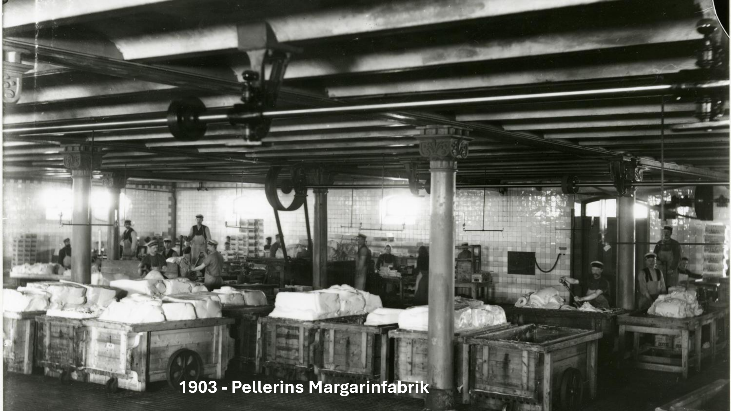
1903 - Pellerins Margarinfabrik