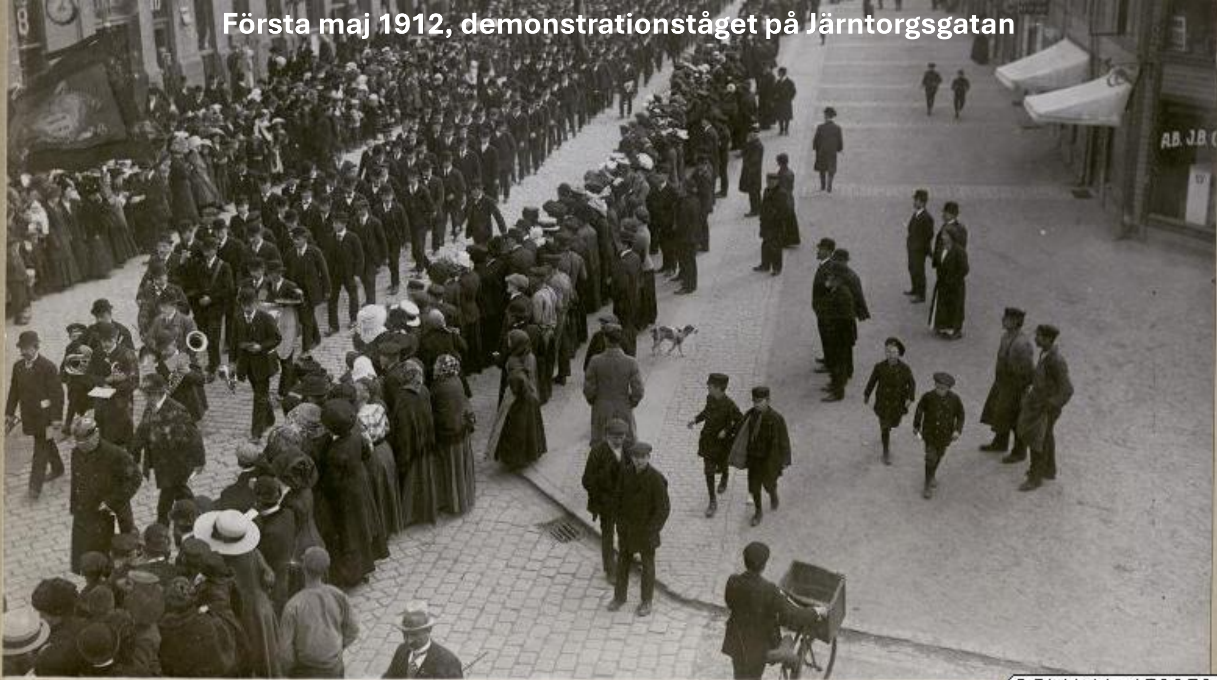
Första maj 1912, demonstrationståget på Järntorgsgatan