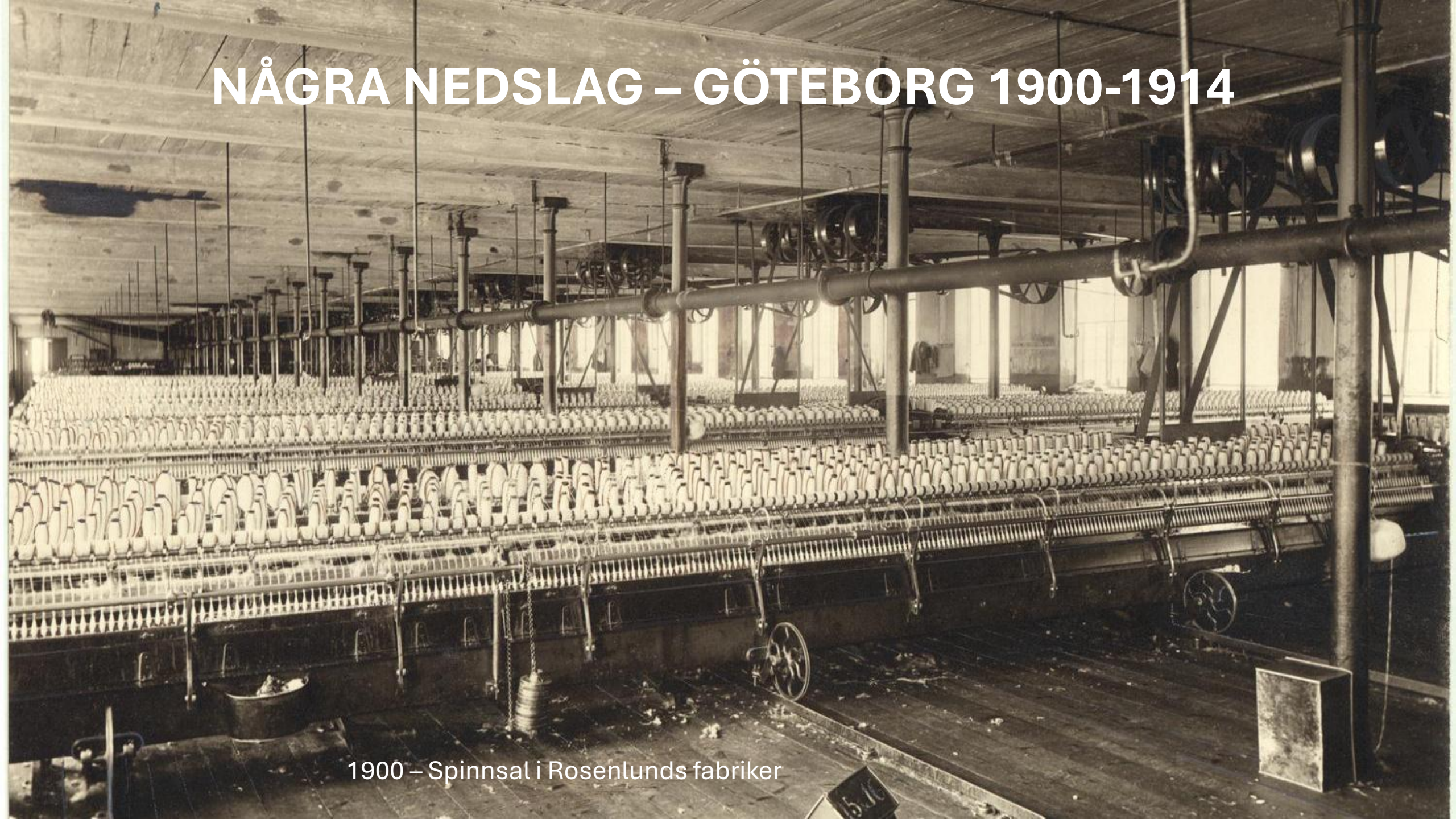
1900 – Spinnsal i Rosentunds fabriker