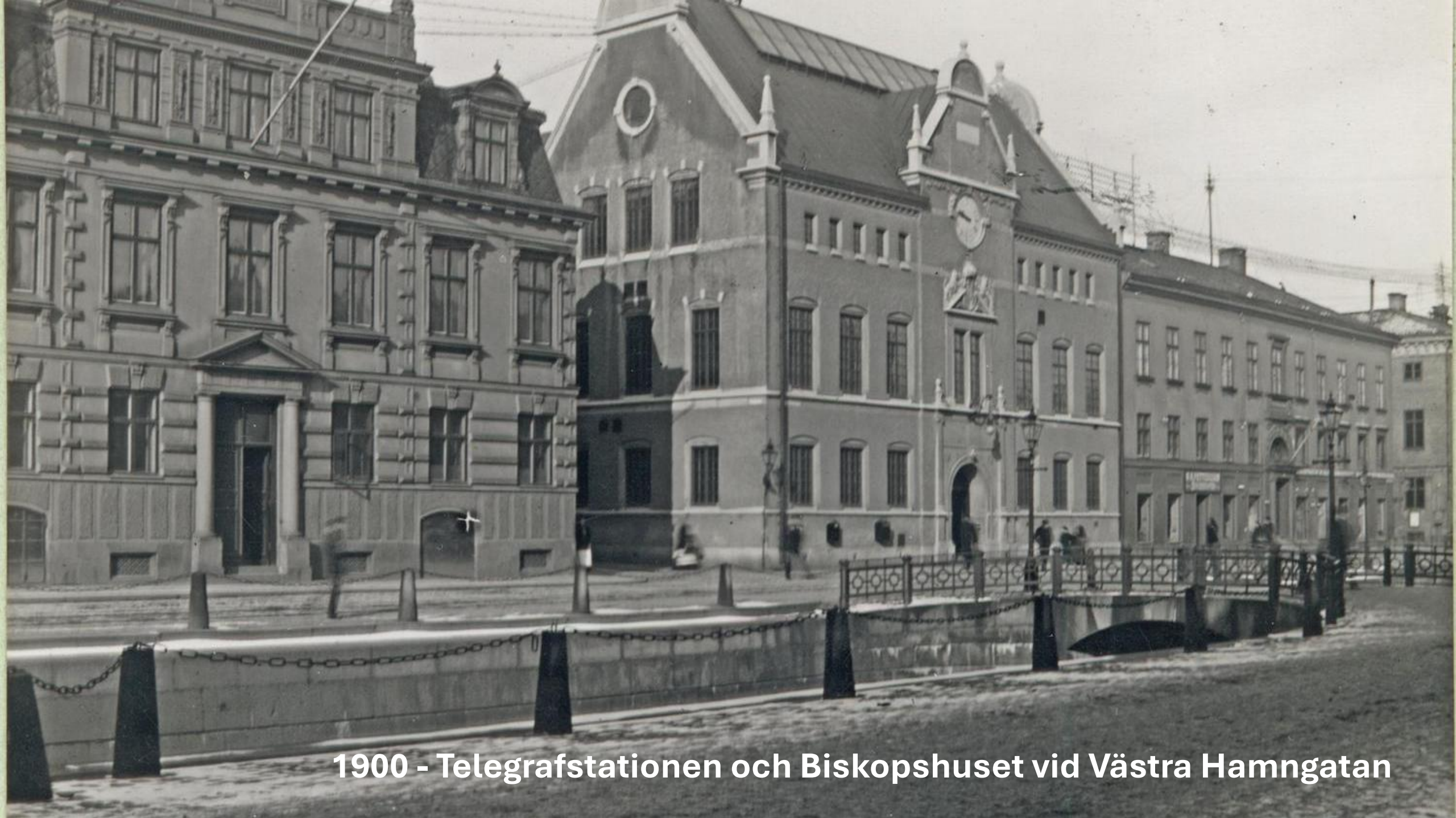
1900 - Telegrafstationen och Biskopshuset vid Västra Hamngatan