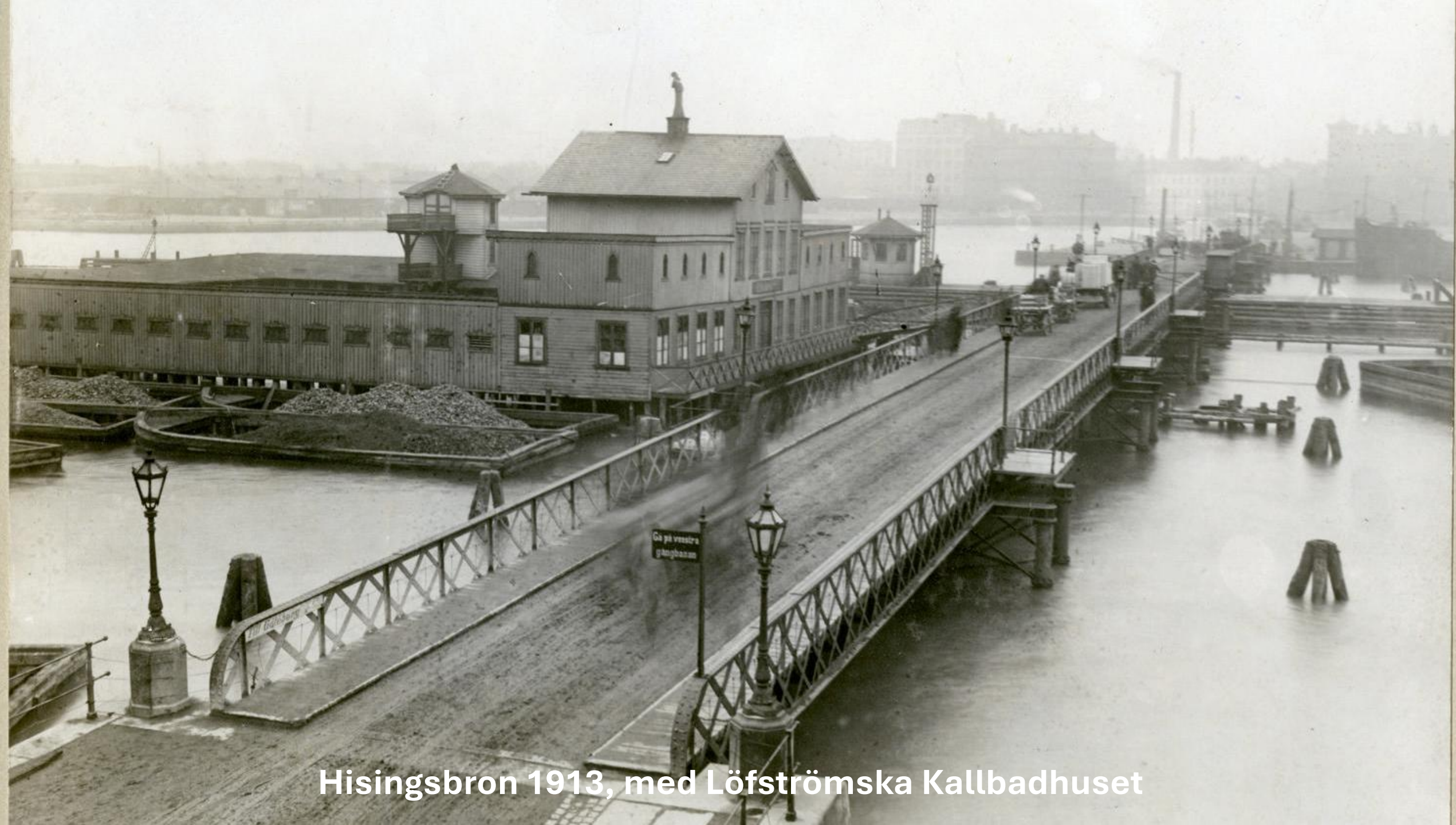
Hisingsbron 1913, med Lofstromska Kallbadhuset