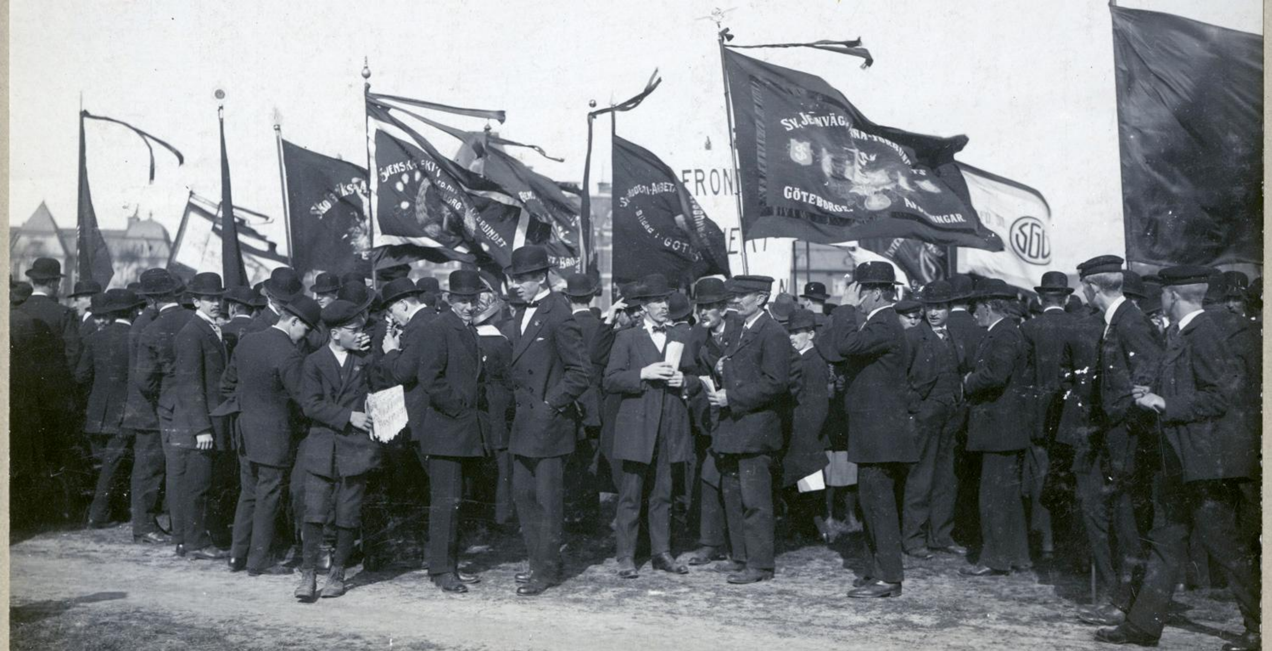
Första Majdemonstration 1914, samlingen på Heden.