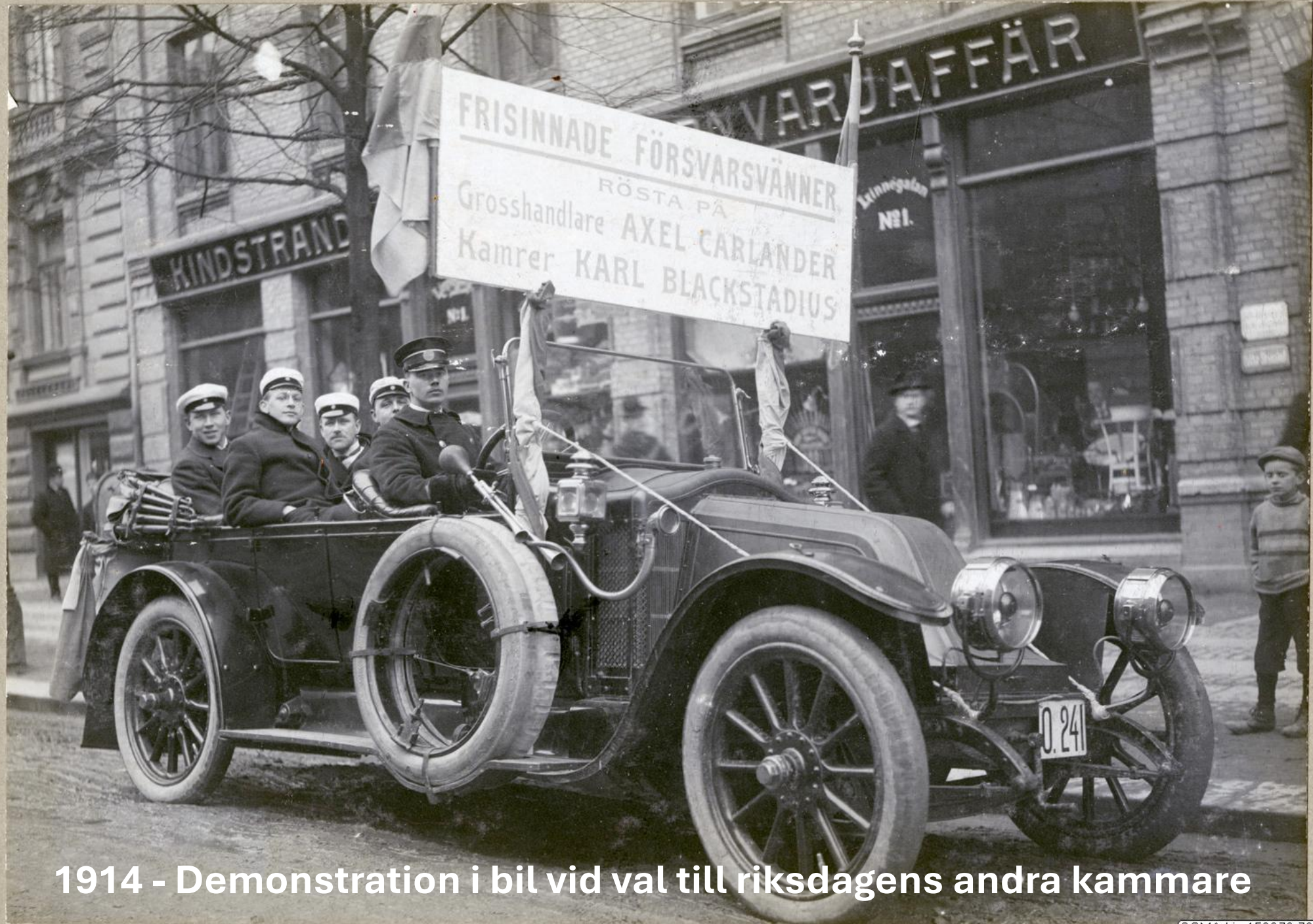
1914 - Demonstration i bil vid val till riksdagens andra kammare