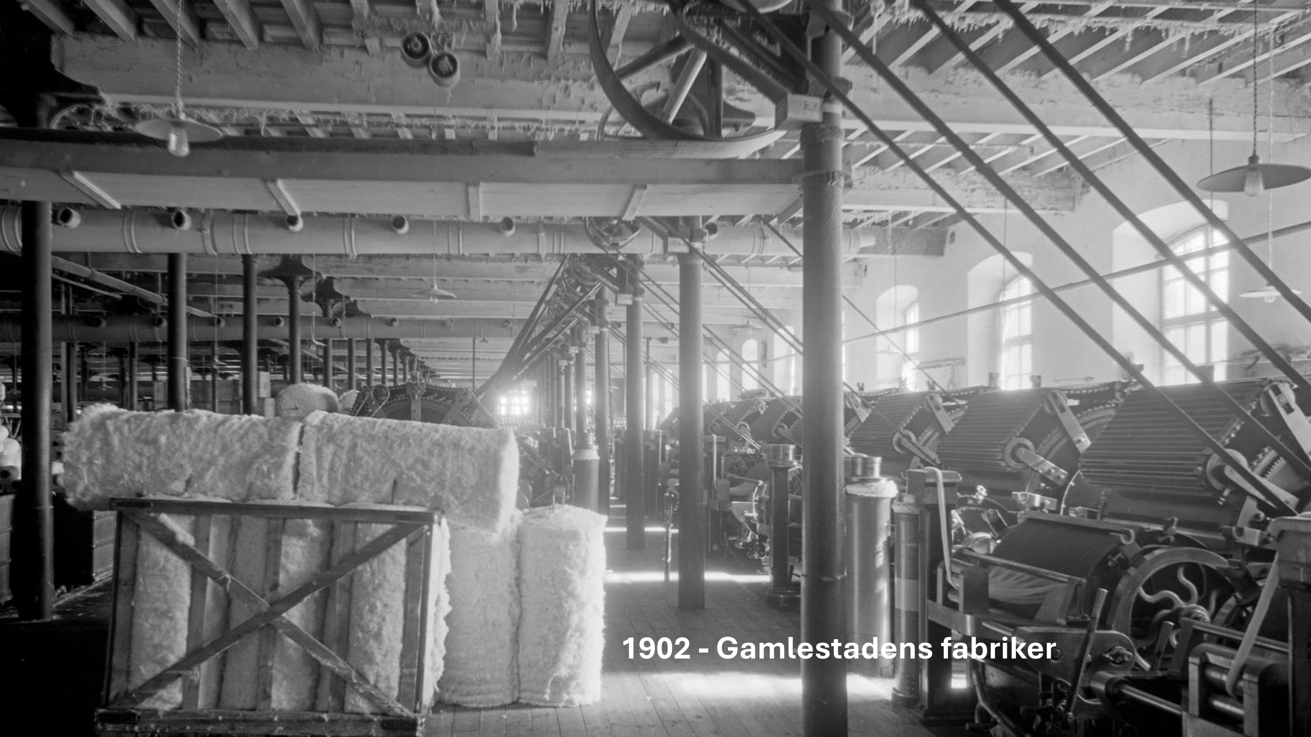
1902 - Gamlestadens fabriker