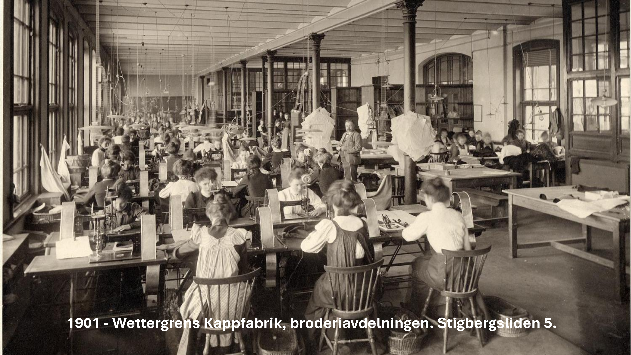
1901 - Wettergrens Kappfabrik, broderiavdelningen. Stigbergsliden 5.