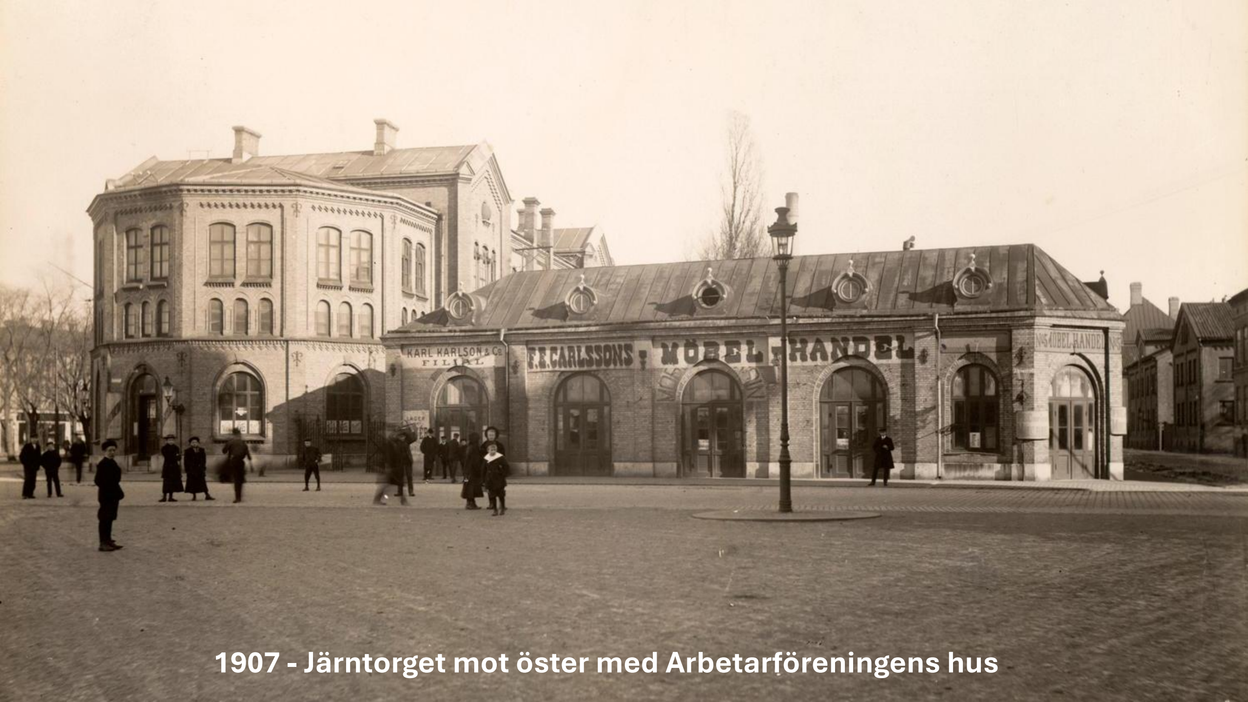
1907 - Järntorget mot öster med Arbetarföreningens hus