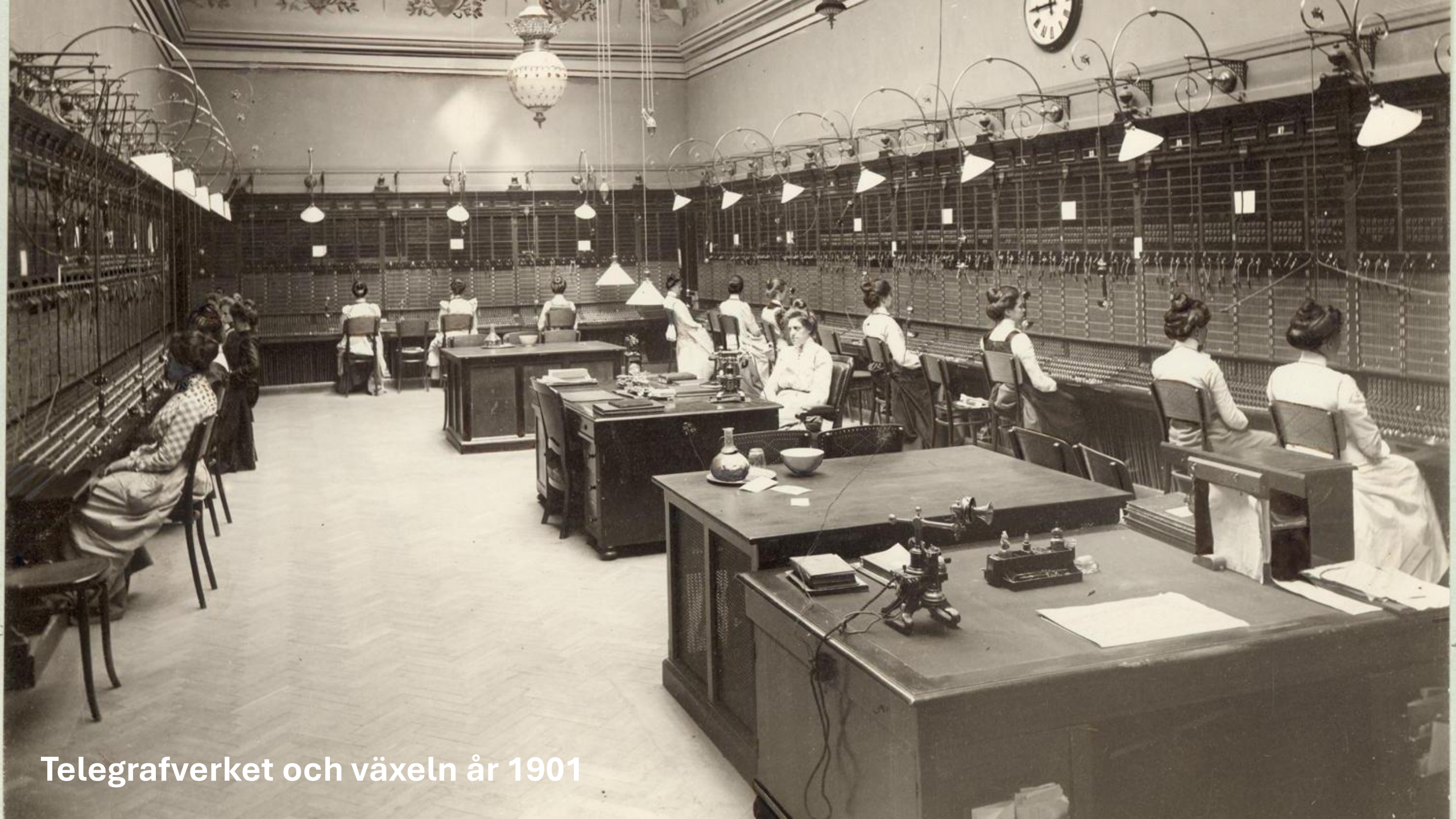
Telegrafverket och växeln år 1901