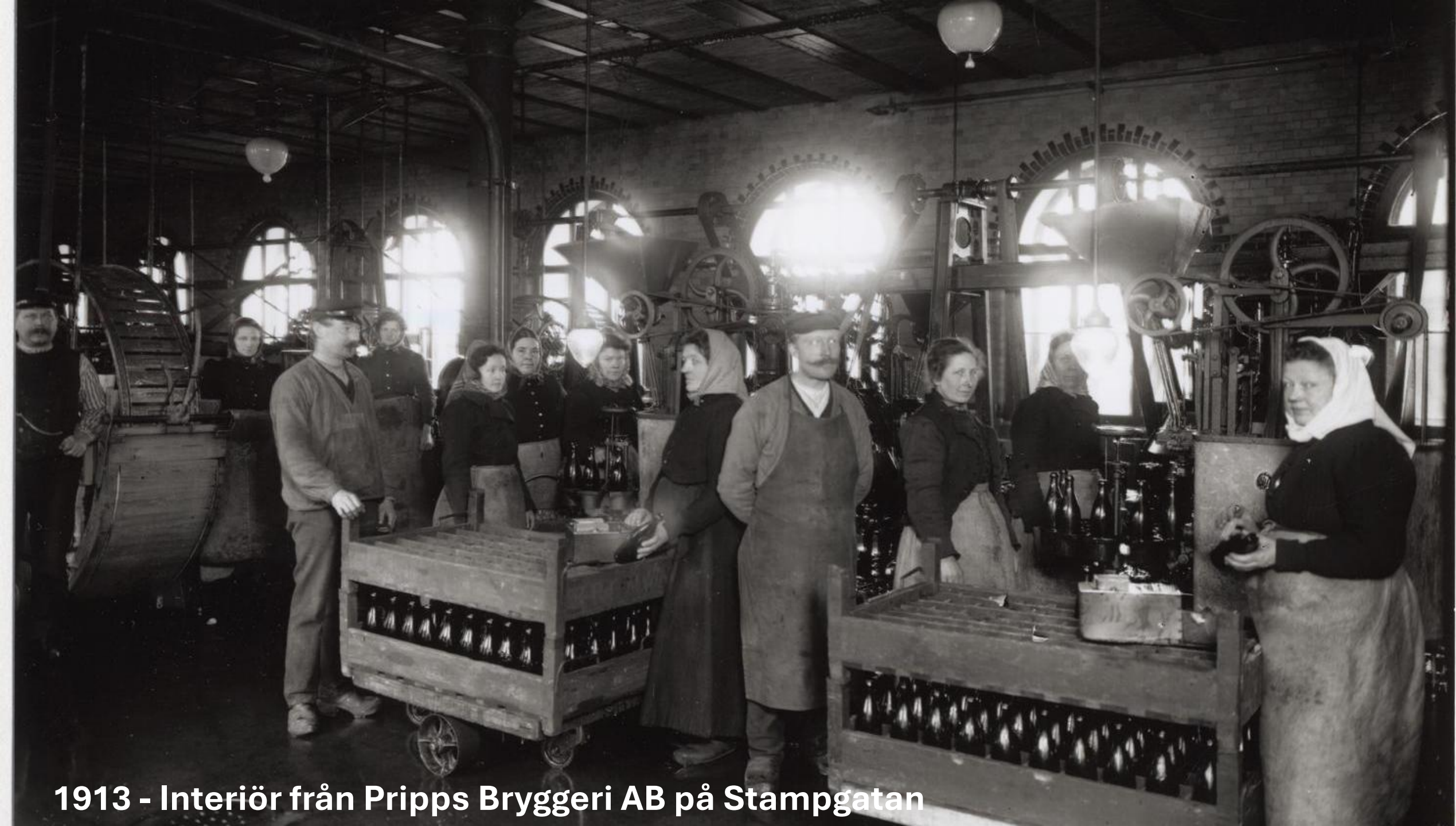
1913 - Interiör från Pripps Bryggeri AB på Stampgatan