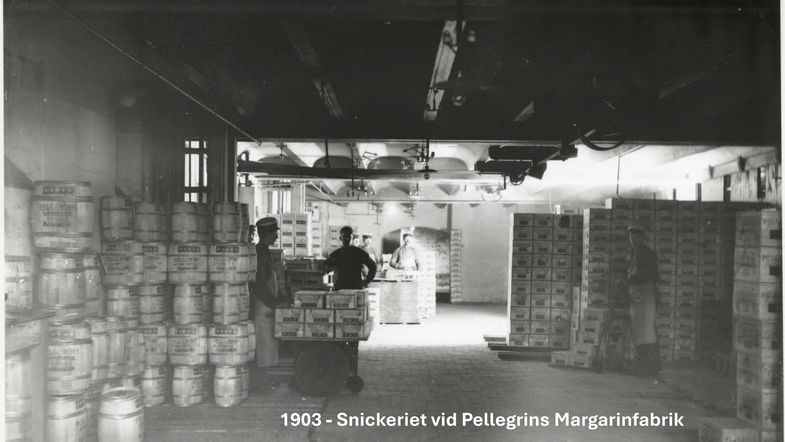
1903 - Snickeriet vid Pellegrins Margarinfabrik