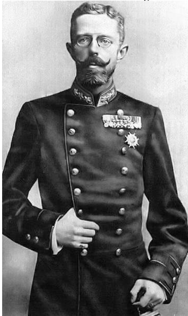
Gustaf V (1858–1950) var svensk kung under första världskriget.

På Sveriges inre förhållanden utövade första världskriget ett betydande inflytande på nästan alla områden och nödvändiggjorde brådskande åtgärder genom en mängd nya lagar och förordningar samt upprättandet av